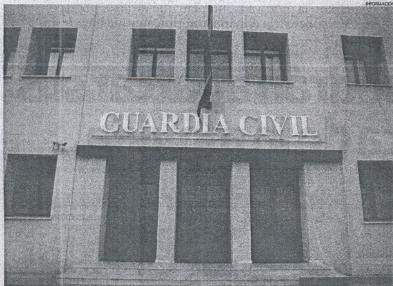
La Guardia Civil de la provincia contará en breve con más de un centenar de nuevos agentes.

GUARDIA CIVIL Según Interior empezarán a trabajar "inmediatamente"