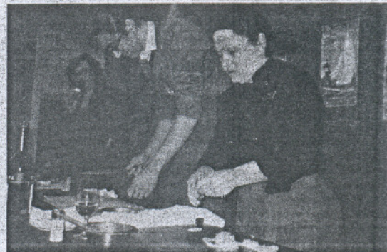
COCINA. Clase culinaria ofrecida a touroperadores checos.

des posibilidades de crecimiento en próximos años. Un crecimiento económico marcado por el aumento del PIB de un 6% presupone que en un futuro a medio plazo el turista checo incrementará notablemente su gasto medio en viajes vacacionales. España tiene un posicionamiento excelente en este mercado, con posibilidad de crecer en todos los segmentos.