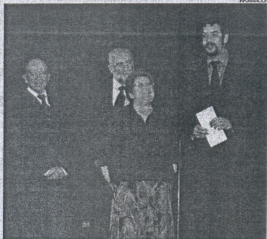
El cortometraje 'El libro talonario' ha cosechado ya varios premios.

Manuel Laynez destacó el trabajo que ha realizado el equipo técnico de la película y de actores, así como la productora Grito Inside Films a la hora de rodar este cortometraje basado en un relato del escritor granadino Pedro Antonio de Alarcón. El filme está ambientado en el año 1877 y transcurre en la propia localidad de Rota, mostrando y promocionando, entre otros escenarios de la localidad, el Palacio Municipal Castillo de Luna.