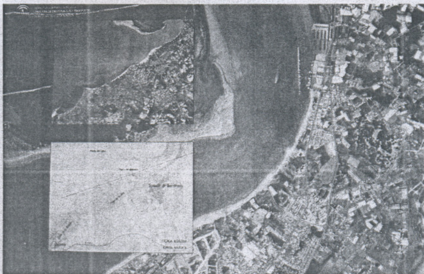
PROYECTO. Hace un mes se presentó el proyecto de la ampliación de la zona.

Para ello será necesario el dragado de 6 hectáreas al norte de