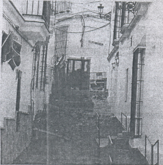
Imagen de las obras en el barrio de Santa María.

Los cortes se deben a las obras de pavimentación y la renovación de las redes de agua en Bohórquez y San José