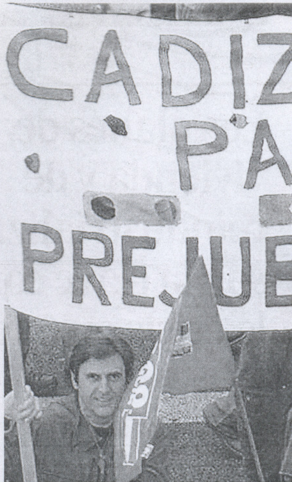
Pancarta que pudo verse en una protesta contra el cierre de Delphi.