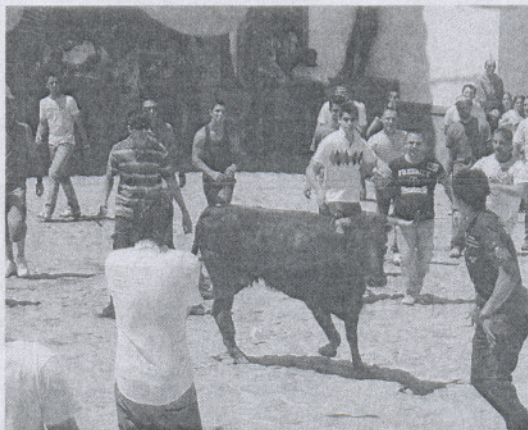
Varios alcalaínos disfrutan de la suelta de toros.