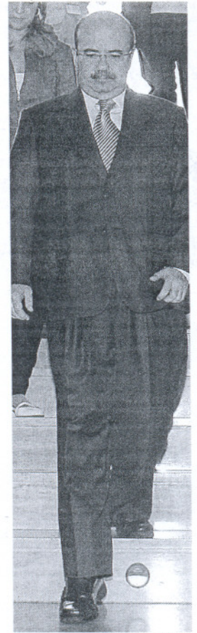
Zarriás, ayer en Córdoba

deral con una repercusión inmediata en los estatutos del partido a nivel nacional. Pero sobre todo, dará más peso a aquellos municipios donde el PSOE obtiene cada cuatro años los mejores resultados. Pasaría