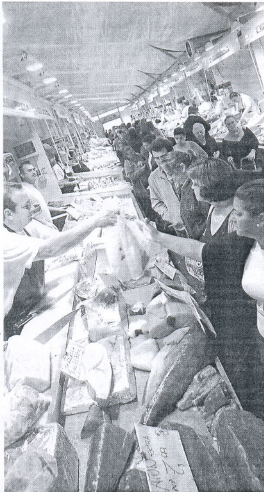
EN VENTA. Plaza de abastos de Cádiz, ayer.