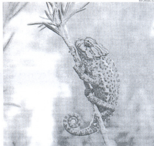
Los camaleones mantienen su hábitat en las dunas de las playas.

En definitiva, para poder hacer posible el lema Respecta a los camaleones, son parte importante de nuestro Patrimonio Natural , la colaboración ciudadana es fundamental, como ha querido destacar el Alcalde, que recordó las penas por ley si no se respeta.