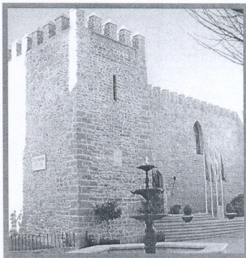
ROTA Y CHIPIONA Arriba, el Castillo de Luna, actual sede del ayuntamiento de Rota. Bajo estas líneas, vista de una de las playas de Chipiona.