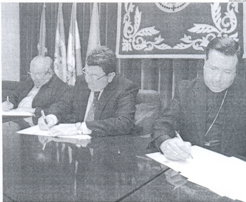
Mediante este convenio se continúa en la línea de trabajo marcada por el Consistorio de recuperar el patrimonio.

Los tres pilares de este acuerdo se centran por un lado en el Ayuntamiento, que realiza una aportación económica con la que financia las labores de restauración