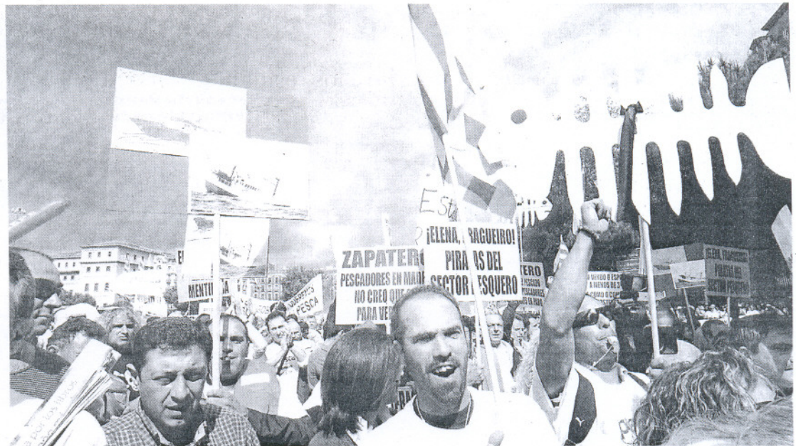
A GRITOS. Los manifestantes pidieron la dimisión de la ministra Elena Espinosa y del presidente Zapatero

Según Antonio Ares, presidente de la Asociación de Armadores de El Puerto de Santa María, el cien por cien de la flota de arrastre de Cádiz ha secundado la manifestación y la huelga. En total, unos 200 pescadores que, en su mayoría, iniciaron el parón de la actividad hace días. La asociación de El Puerto que preside Ares ha sido, precisamente, una de las más reivindicativas, y la primera en adelantar los paros.