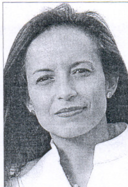
La ministra Beatriz Corredor.

El convenio con el Ayuntamiento de Alcorcón es el primero que ha firmado el ministerio. La idea es llegar a las 500 viviendas en este municipio, aunque por ahora sólo se han concretado dos fases: una promoción para jóvenes que permitirá la construcción de 112 pisos, y otra de