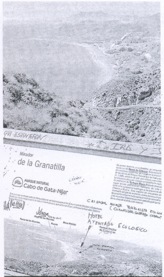
Ejemplo polémico. El hotel de Azata del Sol en la playa de El Algarrobo es un ejemplo del complejo entramado judicial aún no resuelto, iniciado con el deslinde de la zona de costa en el que se edificó el complejo.

En algunas provincias, como Valencia, Baleares y La Coruña no se empezaron los trabajos has-