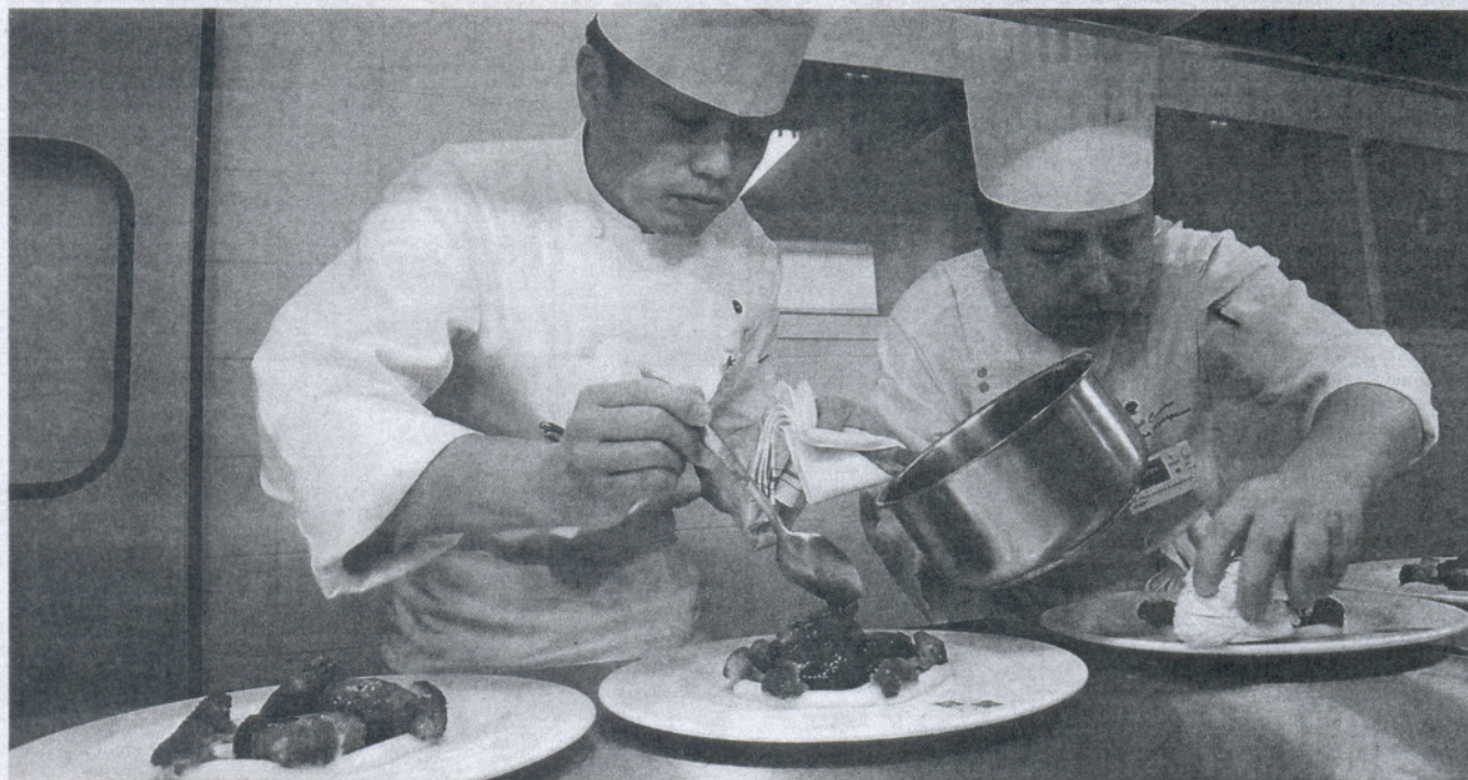
Los cocineros de rasgos orientales preparan sus platos en un concurso de cocina celebrado recientemente en Jerez.