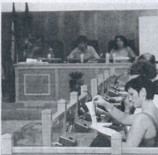
El Consejo de Ciudad, en la reunión para seleccionar las propuestas.

Finalmente, el criterio que ha presidido las decisiones, según se informó, ha sido fundamentalmente priorizar aquellas ideas ciudadanas que favorezcan a todos los sectores de la población y a todas las zonas de la localidad; ha-