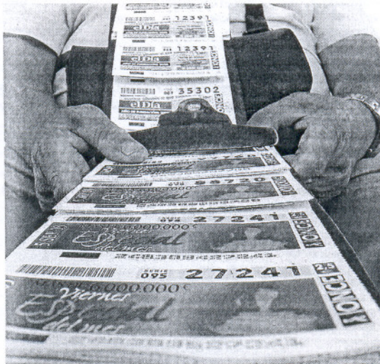
Un vendedor de la ONCE vendiendo cupones.

La Policía desplegó entonces un dispositivo de vigilancia en la avenida Ana de Viya que dio como resultado la localización de un joven cuyas características coincidían con las aportadas por algu-