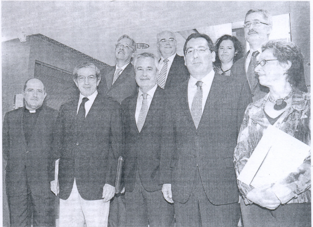
José Antonio Griñán (en el centro), ayer con los presidentes de las cajas y miembros de su gabinete.

En cuanto al programa de reactivación, que se traducirá en una inyección de 1.378 millones,