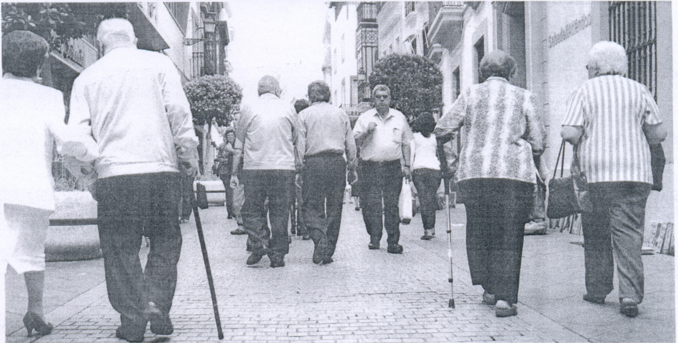
Un grupo de personas mayores pasean por una calle del centro de Sevilla.

BANDERA AZUL Consulte en la sección de Andalucía la lista de playas premiadas por la calidad de sus aguas