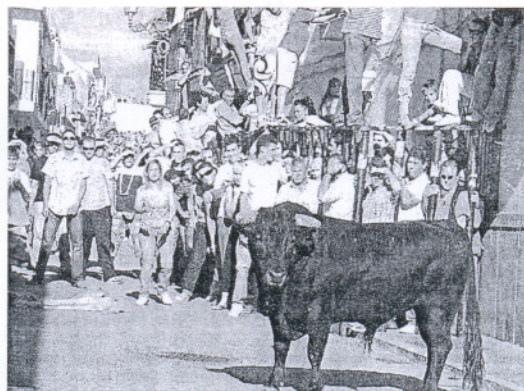
Numeroso público en la última suelta de toros.

Con mucha gente corriendo delante de las reses o resguardadas detrás de las barreras, los paterneros y los muchos visitantes que se acercaron a pesar de ser el último día de Feria, despidieron has-