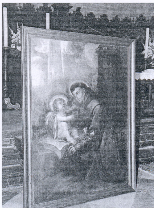
El cuadro de San Antonio de Padua ya está en la parroquia de la O.

El acto de recepción de esta obra ya restaurada vino como