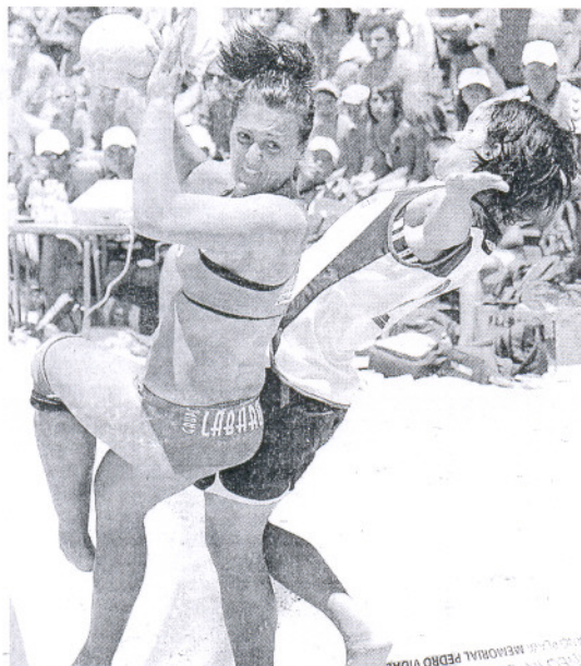
Las féminas de España vencieron a Noruega y lograron el bronce.

Doble título para la 'canarinha' y cuarta plaza del equipo de Fernando Posada