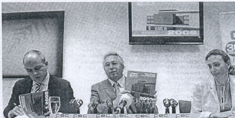
PRESENTACIÓN. De izquierda a derecha, Sánchez Rojas, González Saucedo y Romero.

¿Y dónde podría suceder esto? Aquí es donde está el verdadero problema, puesto que tras las revisiones de Jerez, Chiclaná o Conil en 2008, hay 13 municipios en la provincia con catastros de más de 10 años (que es el plazo que se recomienda acatar para no desvirtuar demasiado el proceso). Entre ellos, están Cádiz (pendiente desde 1996), El Puerto (1994), Puerto Real (1996), Barbate (1994), Tarifa (1994), San Fernando (1999) y Sanlúcar (1999). Los municipios gaditanos con un Catastro más anticuado son Alcalá del Valle y Grazalema (1986).