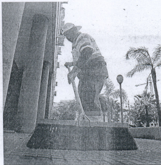
LIMPIEZA. La tasa de basura es de las más volubles.

Jerez se sitúa entre la ciudades que más crecieron con 8420 nuevos vecinos