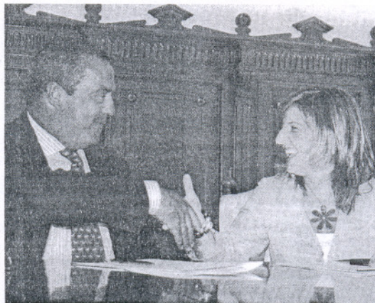
El presidente de la Sociedad de Carreras de Caballos y la alcaldesa, ayer.

En el capítulo de valoraciones, la alcaldesa de Sanlúcar expresó su