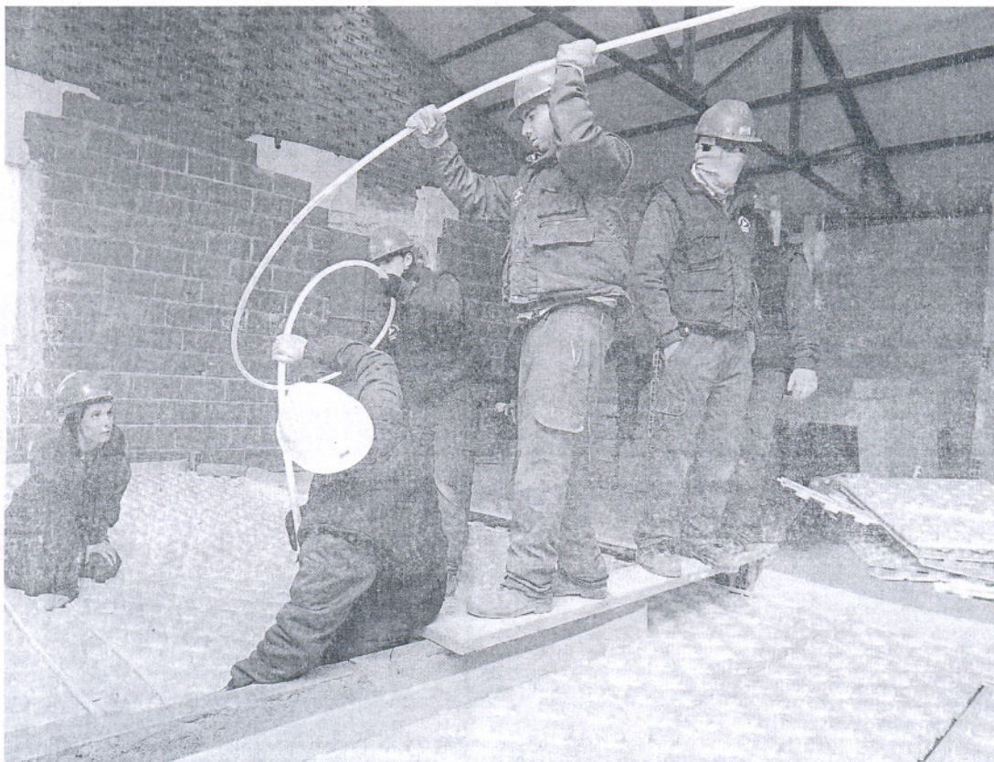
TALLER. Alumnos de un curso de FPO de instalación de calefacciones.