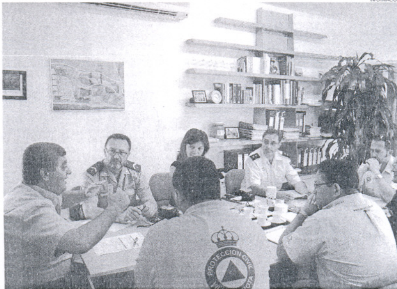
El delegado de Playas reunía a todos los cuerpos de seguridad para debatir las distintas actuaciones.