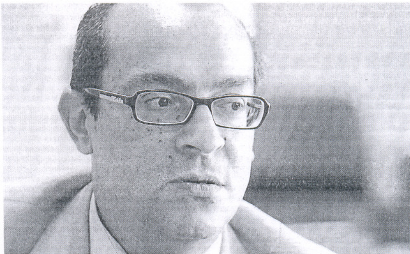
BOUZA. «En materia de empleo, estamos jugando al toque y sin lanzar balones atrás».

El responsable provincial de las políticas laborales asegura que la provincia se está preparando, en todos los aspectos, para ser la primera en la carrera del empleo