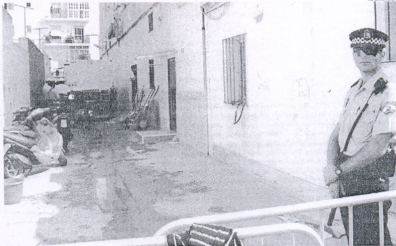
Imagen de la finca incendiada en la calle Virgen de las Nieves de Rota el día después de los hechos.

Según la sentencia a la que ha tenido acceso este periódico, los hechos ocurrieron en septiembre de 2005 cuando los tres acusados, militares en la Base Naval de Rota, fueron a comprar cocaína, por lo que se desplazaron en un coche a la calle Virgen de las Nieves, en el número 4, donde encargaron a I.B.B. que se la consiguiera, para lo que le dieron 60 euros. Según declararon los acusados, les entregó una bolsa con una sustancia que finalmente no era cocaína, por lo que uno de ellos propuso ir a comprar gasolina para prender fuego al bloque de pisos donde habían visto entrar a I.B.B. para así darle un escarmiento por el