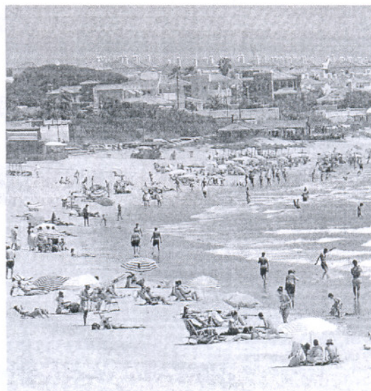
SOL Y PLAYA. Imagen de la playa de La Barrosa en julio.

A nivel regional, Cádiz es la segunda provincia peor valorada de toda Andalucía, sólo superada por Huelva. Así, la provincia que ha obtenido mejor puntuación por parte de sus visitantes es Jaén con casi ocho puntos, seguida por Córdoba.