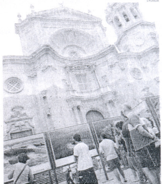
Ayer se inauguró la exposición 'Vivir el mar' en Cádiz.