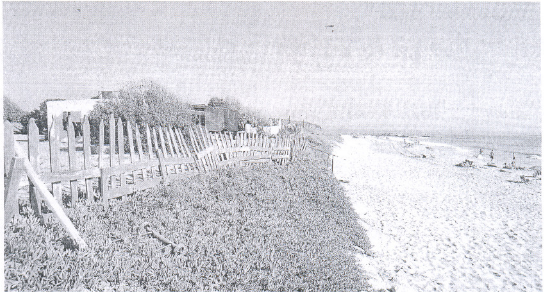
OCIO. Uno de los enclaves donde el Ayuntamiento de Rota tiene previsto abrir un complejo residencial y de ocio.

Queremos saber su opinión, comenta esta noticia en nuestra web: lavozdigital.es