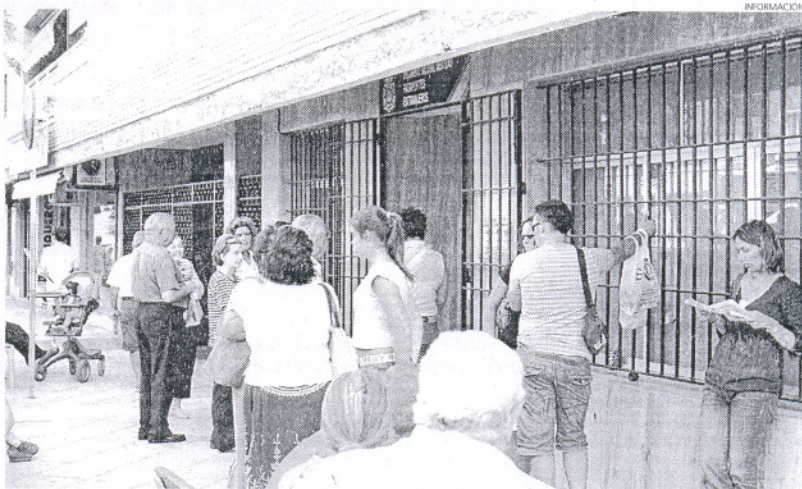
La petición de cita previa para el DNI perseguía el objetivo de acabar con las colas a las puertas de la Comisaría.

Diversas fuentes manifiestan, asimismo, que ante esta circunstancia se presentan a diario y desde primera hora de la mañana un número indeterminado de ciu-