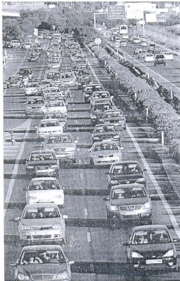
TRES CAMINOS. La circulación en el puente Carranza ha mejorado,

Chiclana tiene problemas de tráfico todo el año, sobre todo en la Avenida de la Diputación y sus alrededores. Esta situación se agrava en verano, sumándose a estos lugares problemáticos los accesos a La Barrosa. Para paliar estos problemas, la delegación de Tráfico ha puesto en marcha un dispositivo especial que incluye la colocación de conos para desdoblar algunas vías, como la carretera del Molino Viejo; y campañas informativas para dar a conocer las diversas alternativas para salir de la zona de costa. En acontecimientos especiales, como el próximo concierto de Hombres G y Melocos, Tráfico y Juventud llevarán a cabo acciones conjuntas para aligerar la circulación. Una