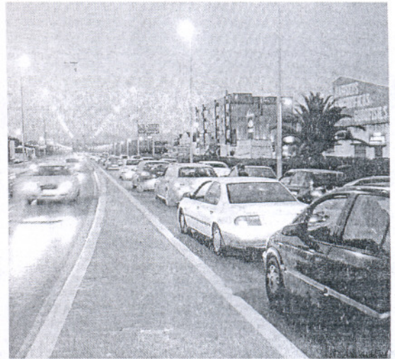
RETENCIÓN. Vehículos la pasada semana en El Puerto.

El Trofeo Carranza, las carreras de Sanlúcar o el Festival de Teatro de El Puerto atraen a miles de visitantes, provocando grandes atascos