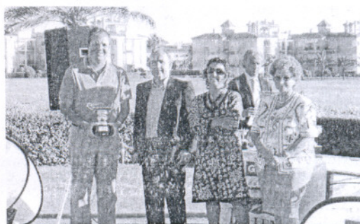
Reparto de premios del Trofeo Villa de Rota. COSTA BALLENA