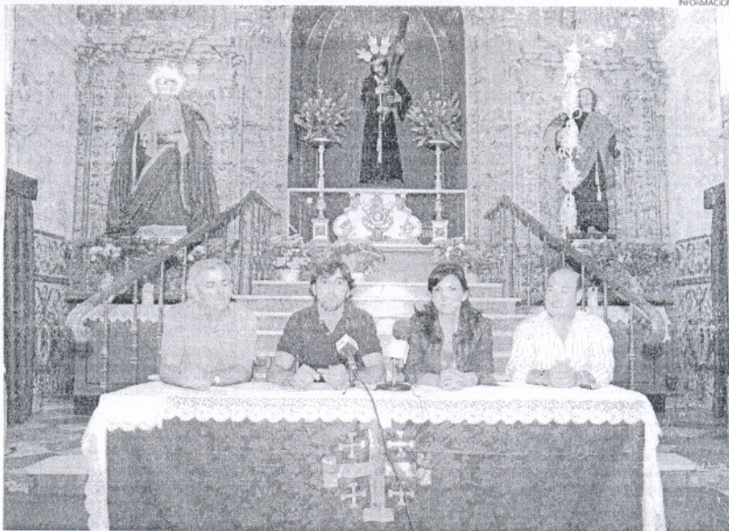
Este nombramiento es de carácter honorífico y será especialmente creado para esta ocasión especial.