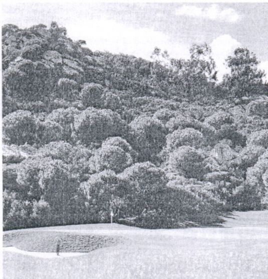
Vista del espectacular campo de La Reserva de Sotogrande.

Todos ellos rodeados por un paisaje verde incomparable con vistas panorámicas de belleza asombrosa. En las tierras altas se encuentran Almenara, San Roque Club I y II, La Reserva de So-