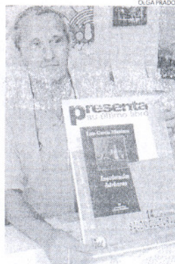
El jueves 14 será la presentación.

Para Franco, el libro reflexiona acerca de cómo el español ha