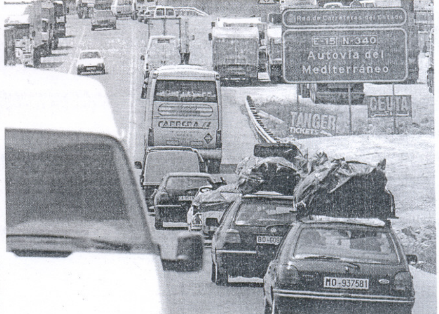
La carretera N-340, escenario de «puntos conflictivos» detectados por la Dirección General de Tráfico

En Sanlúcar, por su parte, el mayor peso de tráfico lo soporta la Avenida Quinto Centenario, entrada casi natural desde Chipiona, especialmente en la Rotonda de las Américas, que se convierte en el nudo donde confluyen las carreteras de Chipiona, El Puerto y Jerez.