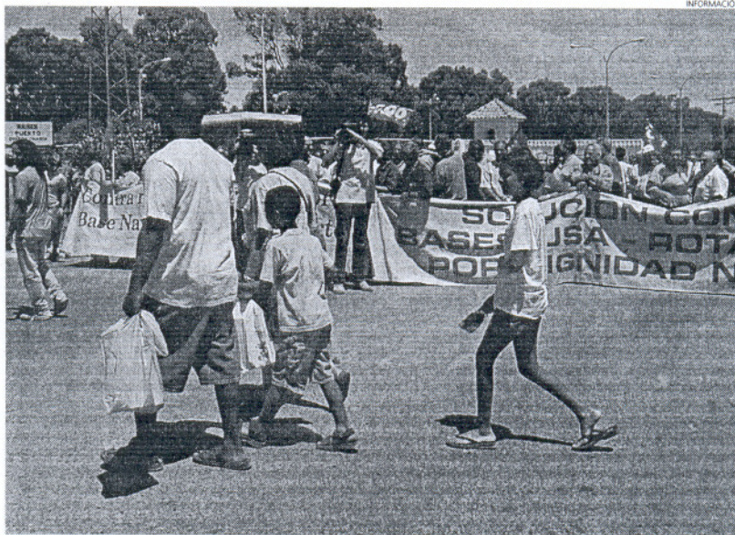
Una pasada protesta, con participación de Izquierda Unida, ante la base naval de Rota.

El cuartel general de Africom actualmente está en Stuttgart (Alemania). "Algunos otros lugares en Europa, como la base naval de Rota, en España, puede servir como importante centro de operaciones para Africom", declaró a mediados de mes el jefe de ese