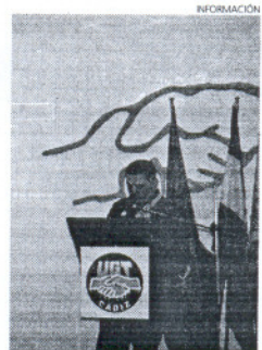
Intervención en el comité.

También se aprobó la resolución presentada por PSP-UGT solicitando el apoyo del comité con los trabajadores y trabajadoras de las empresas Emulisan, Limpieza Viaña y jardinería, Elicodasa Residencia de Mayores y Elicodasa Limpieza de colegios y dependencias municipales, las tres ubicadas en Sanlúcar de Barrameda y dependientes del Ayuntamiento. Responsabilizando el comité a la alcaldesa de Sanlúcar de la situación que están padeciendo los trabajadores y trabajadoras de las mencionadas empresas.