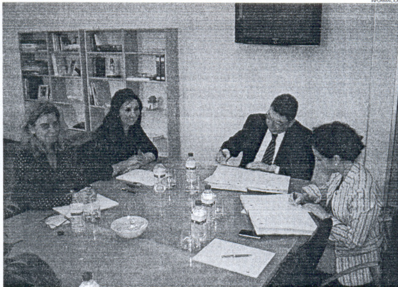
El Consistorio inicia así una nueva línea de actuación en aras de facilitar el acceso a la vivienda de los roteños.

La empresa municipal Sursa será la encargada de poner en marcha en la localidad el servicio que supone este convenio, que va a permitir que la bolsa de vivien-