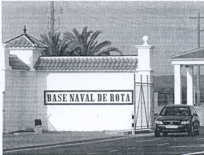
BASE. Imagen de una de las entradas al complejo militar estadounidense de Rota.

Estos planes podrían haberse empezado a fraguar en 2001 cuando Washington consignó la primera partida de 200 millones de dólares para las obras. Este último presupuesto vendría a sufragar los gastos de material logístico de las nuevas instalaciones que servirán de apoyo al mando africano, conocido como Africom.