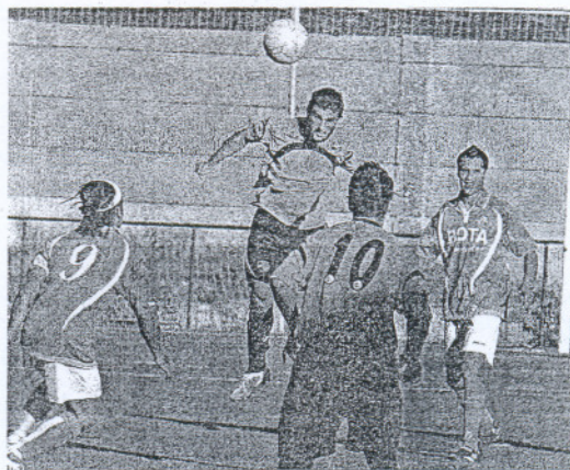
Los isleños lucharon a tope y hallaron el premio.