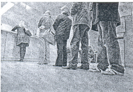
APOYOS. También hay ayudas para los que logren un empleo. /C.O.