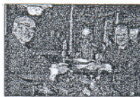
Solbes y Chaves.

1 de octubre. Manuel Chaves y el vicepresidente económico, Pedro Solbes, firman un protocolo de acuerdo con el anticipo de 300 millones de euros.