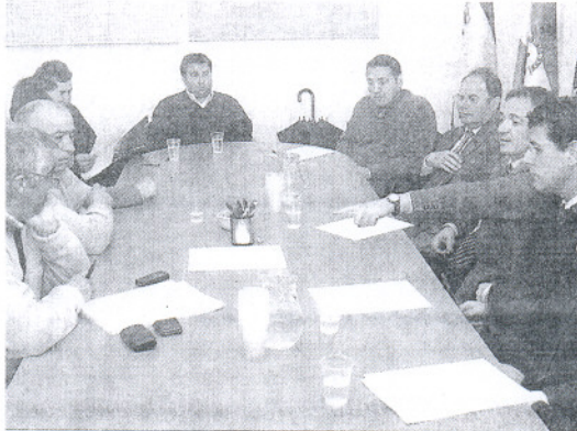
Empresarios y sindicatos constituyen la mesa de negociaciones.

Los representantes sindicales entregaron ayer estas peticiones a la patronal, si bien no se llegó a entrar en materia. En cualquier caso, tanto unos como otros manifestaron su deseo de que las negociaciones no se alarguen en el tiempo y culminen en el período más breve posible. "Consideramos que se trata de modificaciones posibles, no desmesuradas por lo que con-