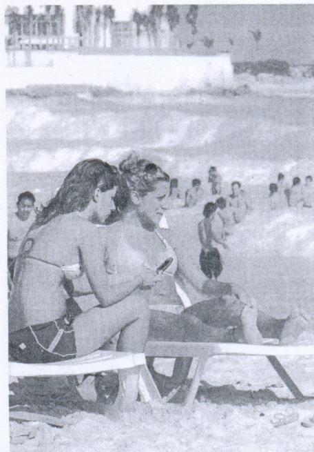
Hay que prever los posibles impactos del cambio climático.

las tendencias a largo plazo de estos parámetros para la temporada de baño, con lo que se conseguirán resultados útiles desde el punto de vista de la gestión de las playas y de la actividad socioeconómica ligada al turismo de playa.