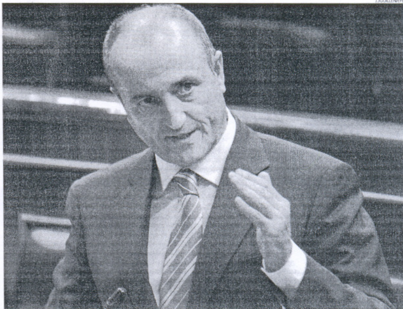
El ministro de Industria, Turismo y Comercio del Gobierno, Miguel Sebastián, en su intervención de ayer.

Además, el ministro de Industria ha avanzado también que el Departamento ha propuesto a la Comisión Nacional de la Energía que el precio de la bombona de butano baje un 2,4% a partir del 1 de julio.