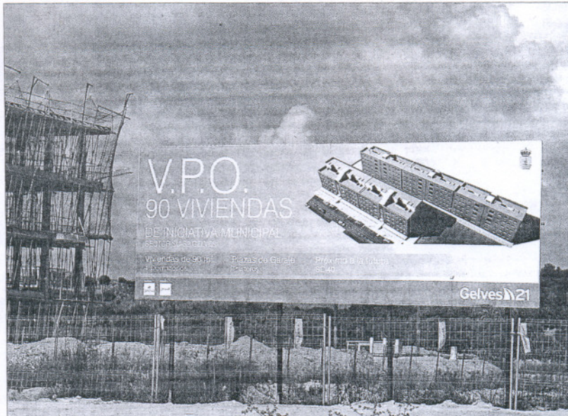
Obras de una promoción de viviendas de VPO en la localidad sevillana de Gelves.

Espadas desgranó, en su primera comparecencia parlamentaria, un decálogo de objetivos gene-