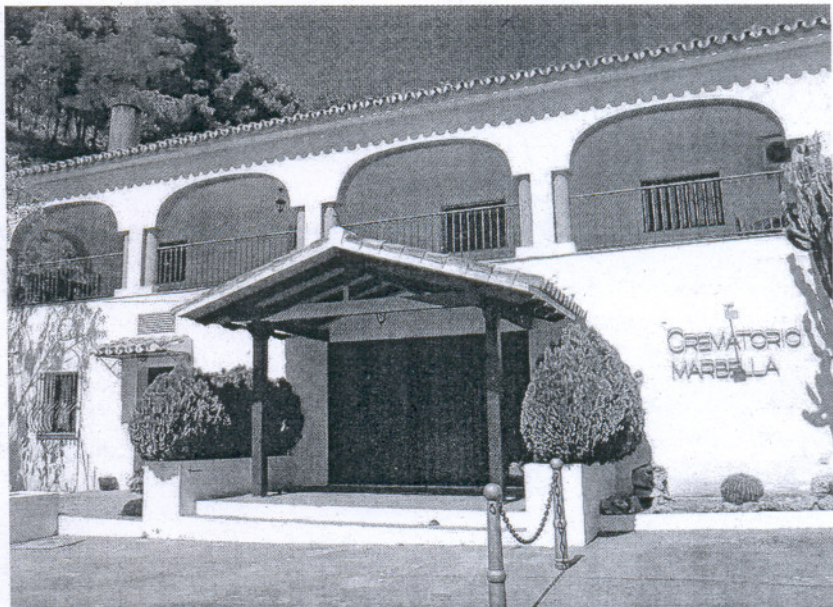
Entrada al cementerio Virgen del Carmen del municipio malagueño de Marbella

Junta y FAMP fijan un plazo mínimo de dos años para tener las leyes que consoliden un nuevo modelo local