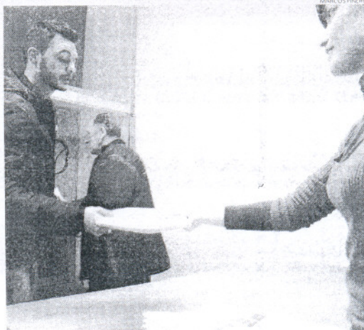
Más de 400 jóvenes han presentado los papeles para recibir los 210 euros.

Las otras dos premisas que deben respetarse hacen referencia a la necesidad de poseer un contrato de arrendamiento de un piso donde se resida con carácter habitual y permanente, además de