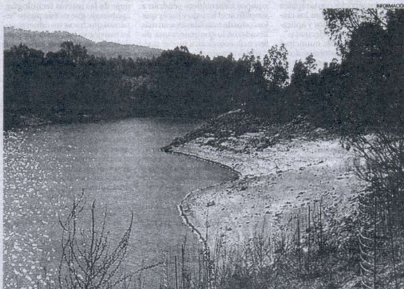
Imagen del pantano de Bornos, que se encuentra al 24 por ciento de su capacidad.

El cuadro muestra la evolución de los pantanos de la provincia a lo largo del año y los datos de la última semana.