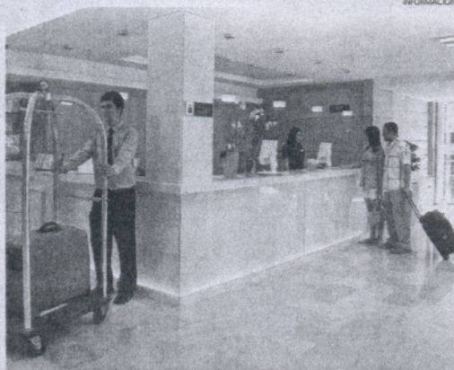
La ocupación hotelera en la provincia, por debajo de lo previsto.

Otro porcentaje alto ha sido el de Arcos de la Frontera, que roza el 80 por ciento -en concreto, un 79,60-, muy por encima de las previsiones que tan sólo le otorgaba