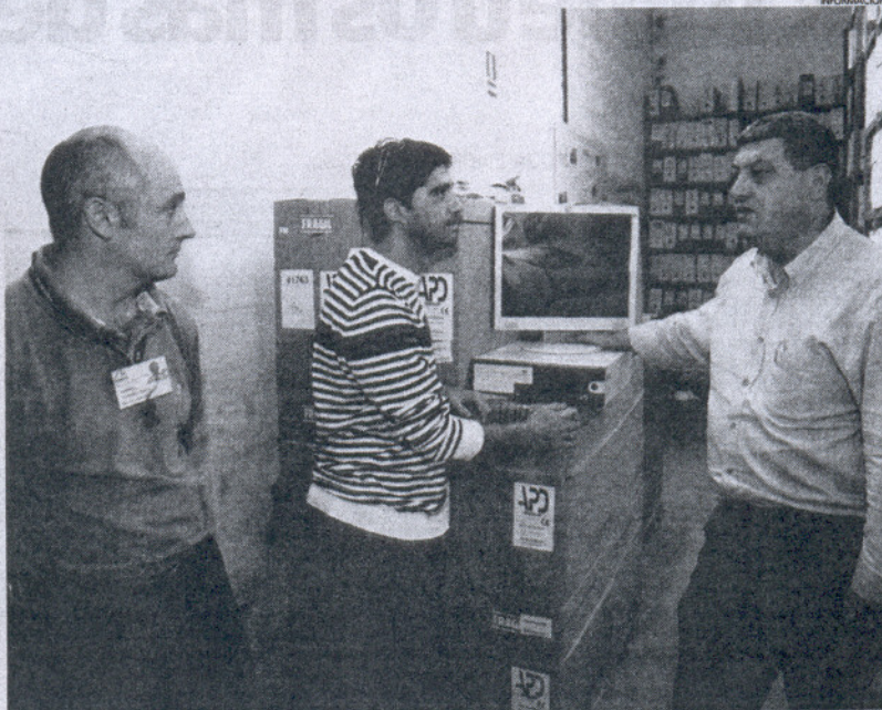
El Ayuntamiento ha apostado por modernizar cada vez más sus sistemas de trabajo a nivel de oficina.

siones en nuevas tecnologías es fundamental para la localidad, ya que la administración "no puede prestar los servicios con la rapidez y eficacia que necesitan los ciudadanos sin los medios y aplicaciones tecnológicas adecuadas".