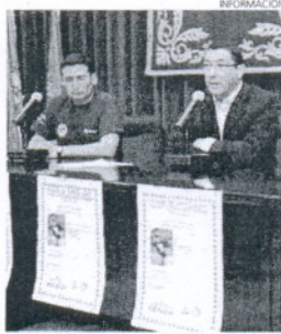
Presentación de los Juegos.