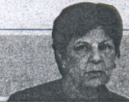
Josefina Cruz Villalón Secretaria General de Infraestructuras de Fomento

El Ministerio de Fomento se siente muy orgulloso de todas las actuaciones que ejecuta en Cádiz en los últimos años"