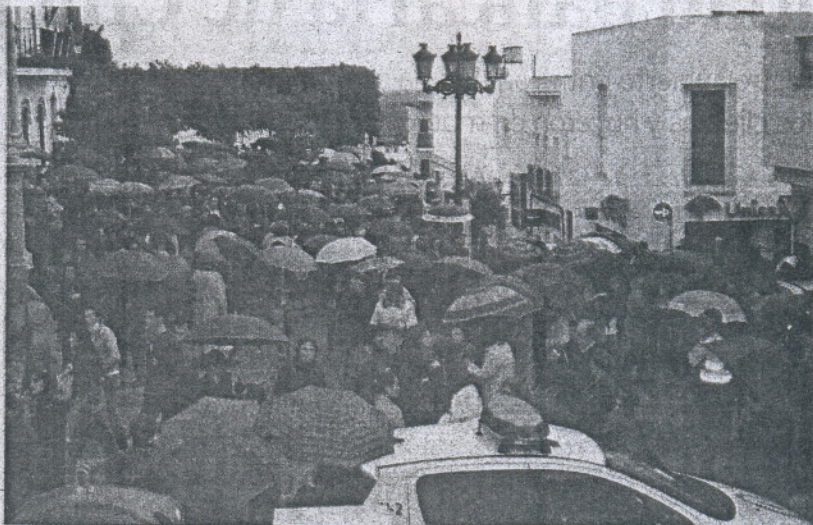
Centenares de personas pidieron en Conil que el crimen de la joven "no quede impune".

Todas las imágenes de las concentraciones, en nuestra web