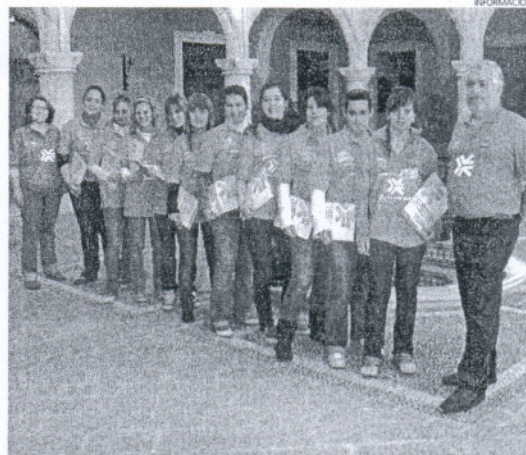
La participación de los alumnos de comercio será fundamental.

En una segunda fase se prevé la presentación de la mascota de la Delegación Municipal de Consumo, Ómico, así como el uso de una carpa que se instalará por diferentes puntos de la localidad para informar a los ciudadanos como consumidores.