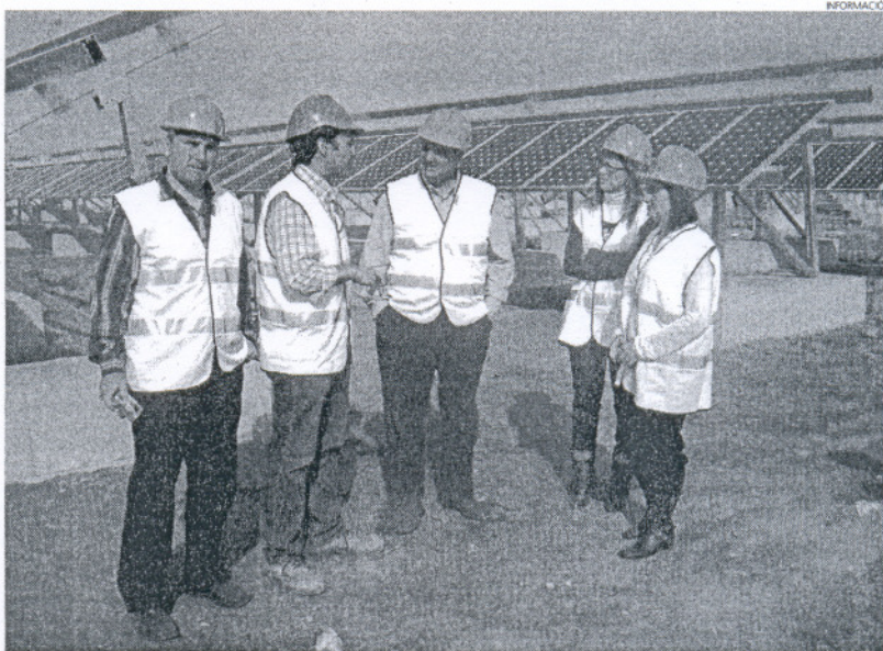
Con estas instalaciones se inicia un camino hacia la producción de energías limpias.