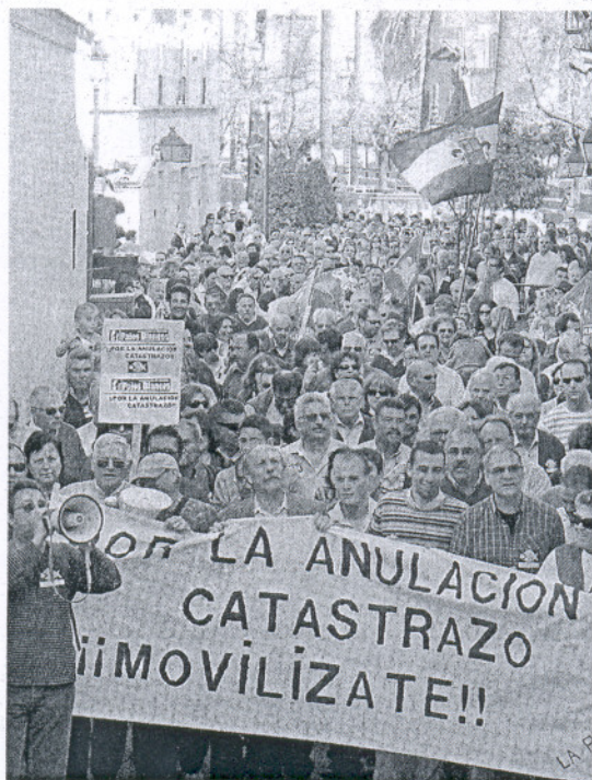
Jerezanos que participaron ayer en una protesta contra el 'catastrazo'. G. TORO

Lo sabían los gobiernos municipales, que retrasan hasta el extremo las actualizaciones para evitar "comerse" el conflicto, y los ciudadanos, pero, además, los excesivos fallos detectados en localidades como Conil o Jerez han puesto en entredicho los sistemas de medición empleados por este organismo dependiente del Ministerio de Economía y Hacienda. Invernaderos co-