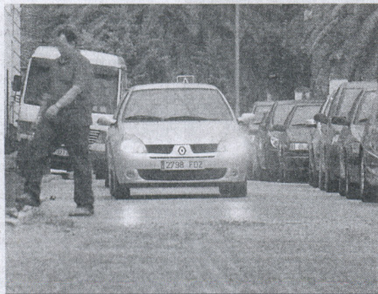
En la fotografía se aprecia el doble asfalto de la vía.

El delegado de Urbanismo asegura que se terminará "a la mayor brevedad posible" ante la preocupación de los vecinos