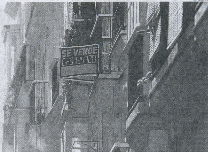
La capital gaditana tiene el precio del metro cuadrado más caro de toda la provincia.

A nivel provincial, el municipio que ostenta el precio medio más caro del metro cuadrado es la capital gaditana con 3.229 euros (lo que la sitúa por encima de la capital de España, en la que el precio medio del metro cuadrado as-