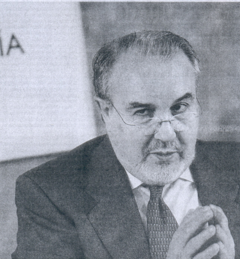
Pedro Solbes, ayer, en la presentación del nuevo modelo de financiación autonómica.

do de Compensación Interterritorial. Éste supone recursos para inversión, el nuevo de Cooperación facilitará partidas para otros menesteres, como educación. Griñán cree que "hay que dar un impulso a la formación permanente del profesorado, a un sistema de becas más amplio y más exigente en estudio y en rendimiento; el despegue de Andalucía se tiene que hacer con un mejor modelo educativo". Él cree que la nueva financiación ayudará en esa tarea. Cuando se cierre con números precisos; más allá de las musas y la literatura.