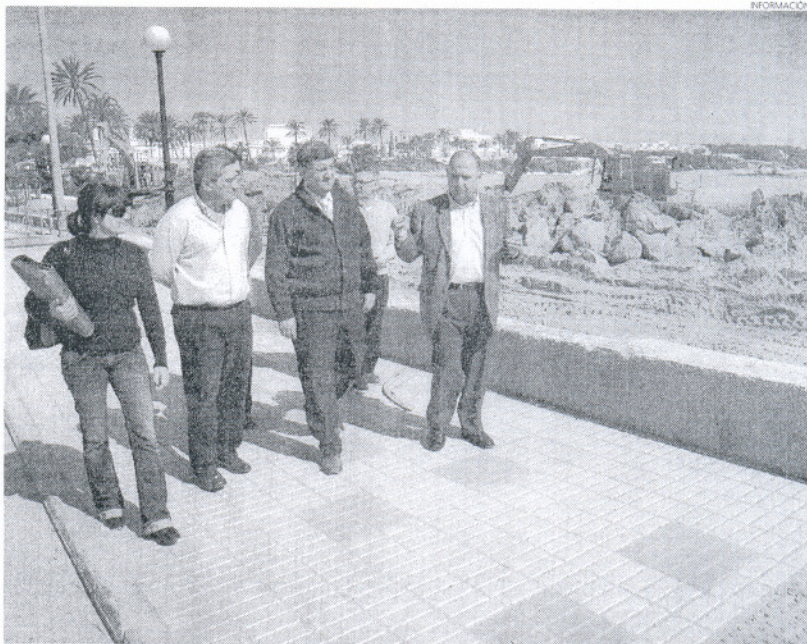
En la imagen, un momento de la visita a las obras iniciadas en la avenida de San Juan de Puerto Rico.

Así, las obras harán posible la instalación de un colector de grandes dimensiones que sustituirá al antiguo preexistente, y que permitirá que las aguas pluviales sean evacuadas a través de un tubo de mayores dimensiones y que se adentra más en el mar. De esta forma, se consigue contar con más capacidad a la hora de desalojar el agua en épocas de lluvias, al mismo tiempo que se aleja esta salida de la playa, solucionando dos inconvenientes que hasta ahora