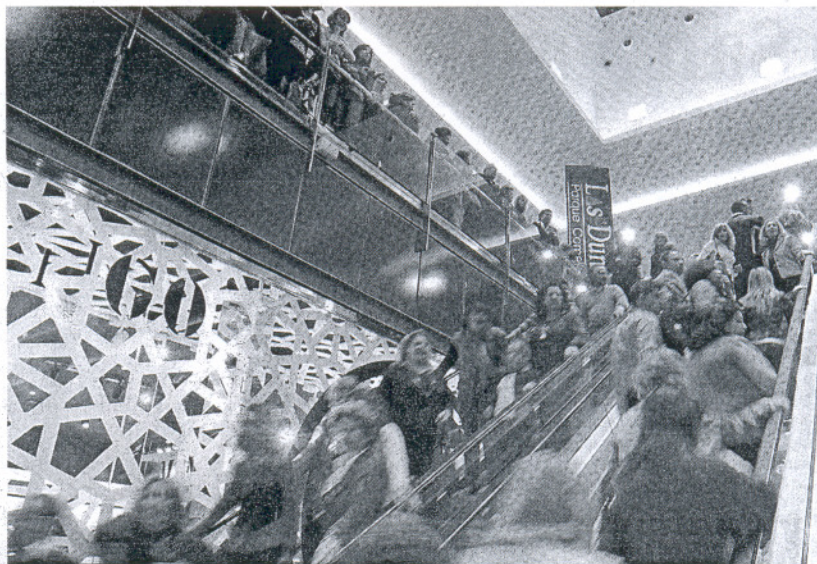
Una imagen del Parque Comercial Las Dunas el 4 de marzo, día de su inauguración.

De acuerdo con la versión del Bloque de Progreso, la "multa" que propone "podría ser una importante inyección económica para el Ayuntamiento". En referencia a la cuantía de la sanción que plantea, asevera que "puede