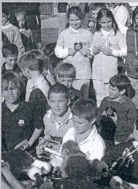
Costa Ballena. El Pequecircuit de Andalucía visitó este campo con la habitual animación y bullicio.