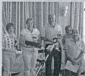
Antequera. Los ganadores del Torneo del Atún, muy competido.