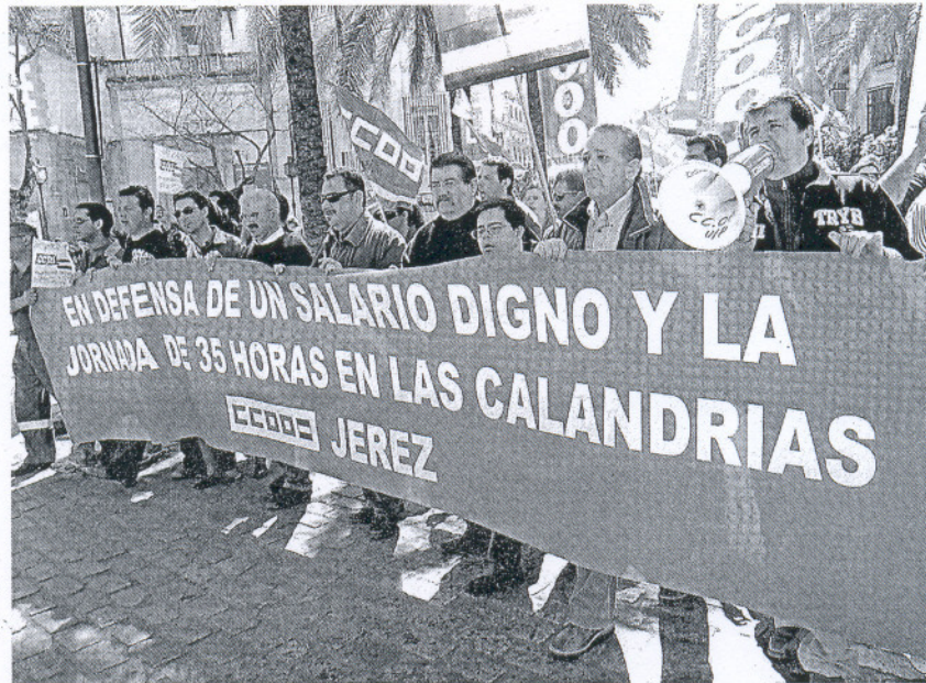
PROTESTAS. Los trabajadores esperarán hasta el viernes para comprobar los avances.

La propuesta de los trabajadores de esta UTE (Unión Temporal de Empresas) es un acuerdo provisional para los próximos tres meses, hasta que entre en vigor el convenio colectivo del nuevo consorcio -previsto por el Consistorio- que gestione las plantas de