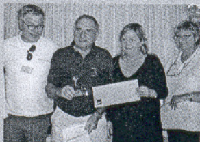
La Cala. Ganadores del torneo benéfico celebrado en este campo.