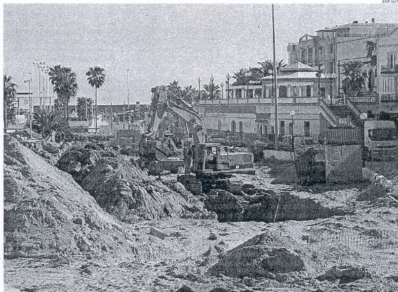
El Ayuntamiento tratará de mejorar sus dotaciones municipales, como la avenida San Juan de Pto. Rico.