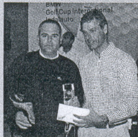
Alborán. El ganador del BMW Golf Cup, con el gerente del club.