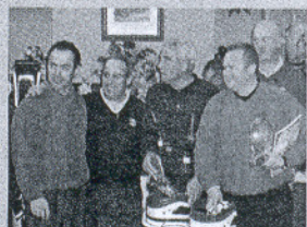
Añoreta. La A.P.G-A celebró otro de sus famosos pro-ams.