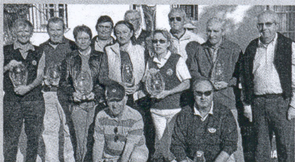
Arcos Gardens. El Circuito Senior que organiza Unicaja fue una magnífica ocasión para conocer este campo gaditano.