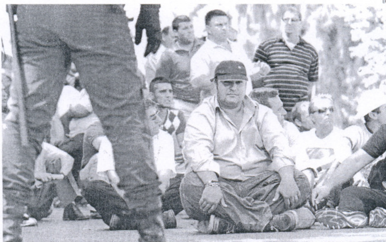
Los pescadores hicieron una sentada en Sevilla ante la atenta mirada de las fuerzas de seguridad.

De los siete marineros detenidos, tres son del puerto onubense de Punta del Moral, en Ayamonte; dos de Isla Cristina (Huelva), y uno de Sanlúcar de Barrameda, concretaron a Efe representantes del sector, mientras que la procedencia del séptimo arrestado no ha trascendido. Todos ellos estaban prestando ayer declaración en el juzgado de guardia de Sevilla. Entre los pescadores hay una docena de heridos con contusiones y hematomas, y los demás se concentraron a las puertas de los juzgados a la espera de