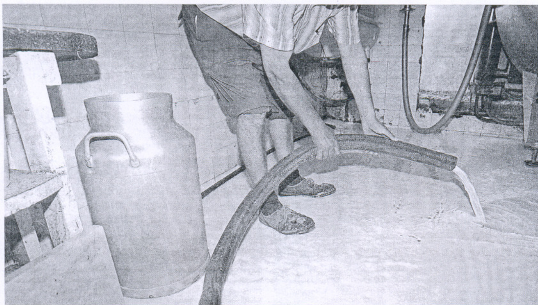
Un productor de leche se ve obligado a tirar miles de litros diarios de este producto al no tener salida.