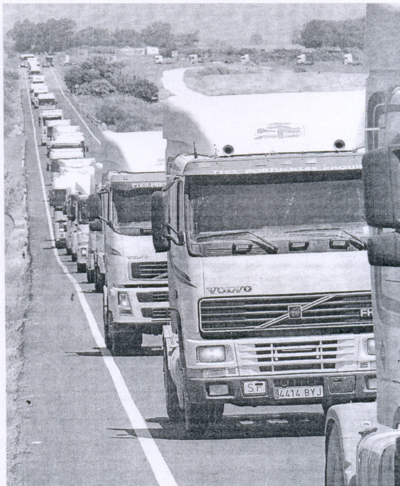
Cientos de camiones marcharon ayer por la carretera de Sanlúcar.

Mientras tanto, persiste la falta de alimentos básicos en los supermercados de la provincia. Productos como la leche, agua embotellada, verduras, huevos o pescado son los géneros que más escasean en esos establecimientos, si bien las plazas de abasto mantienen a duras penas su oferta de frutas y otros artículos de primera necesidad. Al conflicto se une el malestar y temor de la industria cárnica que ha manifestado una profunda preocupación por la situación desencadenada a raíz del paro que se está desarrollando en