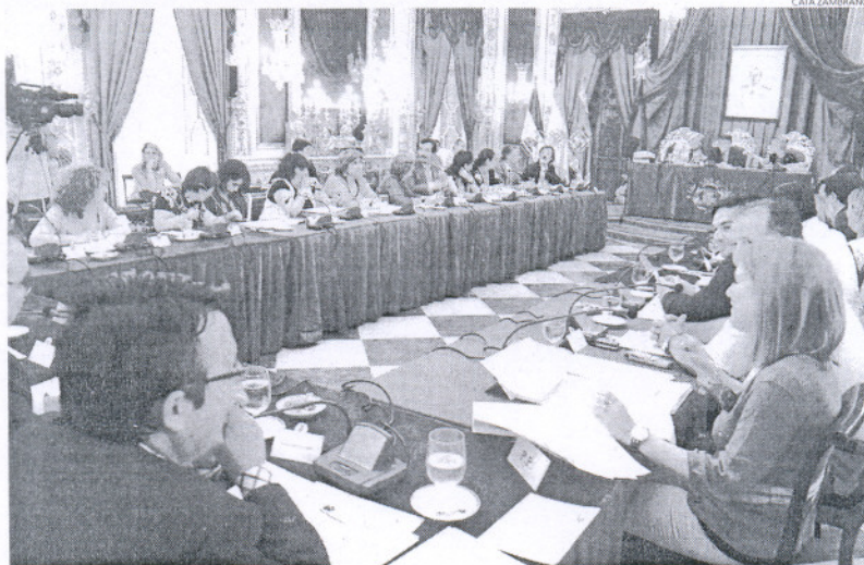
En primer término el Grupo Popular durante la sesión plenaria celebrada ayer en el Palacio Provincial.