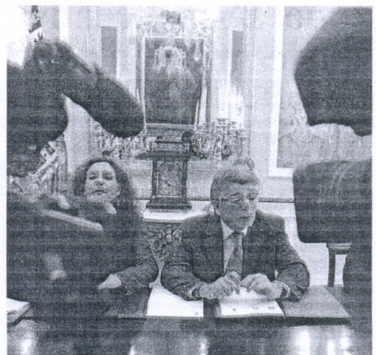
La consejera de Salud y el presidente de la Diputación.

A pregunta de los periodistas, la consejera desmintió las críticas vertidas por el parlamentario andaluz del PP, Antonio Sanz, sobre los contratos "megabasuras" de Salud, afirmando que "el 95% de la plantilla del SAS será con plaza en propiedad o titulares fijos cuando finalice en unos meses la Oferta Pública de Empleo". Montero reconoció "dificultades" para cubrir las vacaciones del personal por falta de especialistas "común a todo el sistema nacional" y por eso destacó el "esfuerzo" de las administraciones.