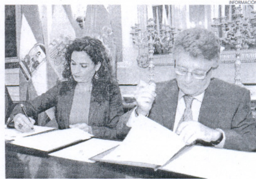
La consejera y el presidente de Diputación, durante la firma del convenio.

ambas instituciones, 20 centros de atención primaria y consultorios. En ejecución se encuentran los centros de salud de San Roque, Los Barrios y Chipiona; la remodelación de los consultorios de El Colorado (Conil) y El Palmar (Vejer) y la dotación de nuevos equipamientos en La Barca de La Florida (Jerez) y Puerto Serrano. En Arcos están previstos un centro de atención primaria en El Santiscal y un consultorio en Jédula.