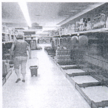
Las tiendas de Sanlúcar están ya casi desabastecidas.