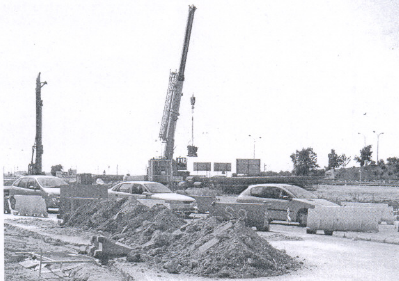
El tren metropolitano entre San Fernando y Chiclana se incluye entre unas medidas que se suponen "de choque".

Así las cosas, será difícil concienciar a los gaditanos de que se ha tenido en cuenta a la provincia cuando las "iniciativas" ante la crisis se