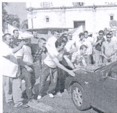
Los piquetes no permitieron la circulación.