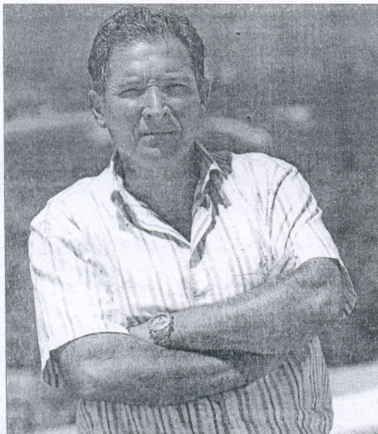
Pedro Sánchez denunció por soborno al alcalde de Benitaxell.