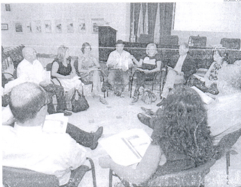
Al encuentro informativo acudían numerosos representantes de los principales establecimientos hoteleros.

En el transcurso del encuentro, al que asistieron los directores y responsables de los hoteles Duque de Nájera, Playa de la Luz, Elba Costa Ballena, Colón Costa