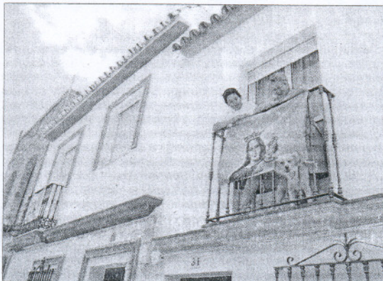
Una imagen de María Auxiliadora en Morón, el pasado mayo.