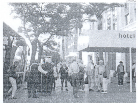
Cádiz es destino de muchos turistas gracias a las agencias de viajes.

que es de más de dos agencias por 10.000 personas. Por otra parte, Andalucía ha registrado el cierre de 49 agencias de viajes en el primer semestre de 2008, lo que supone una disminución del 4 por ciento sobre el total, y sólo entre Sevilla y Córdoba se cerraron un total de 33. Las provincias de Granada y Almería, con seis y tres agencias abiertas, fueron las únicas que registraron un aumento de este tipo de establecimientos, según informó ayer la empresa del sector turístico Amadeus.