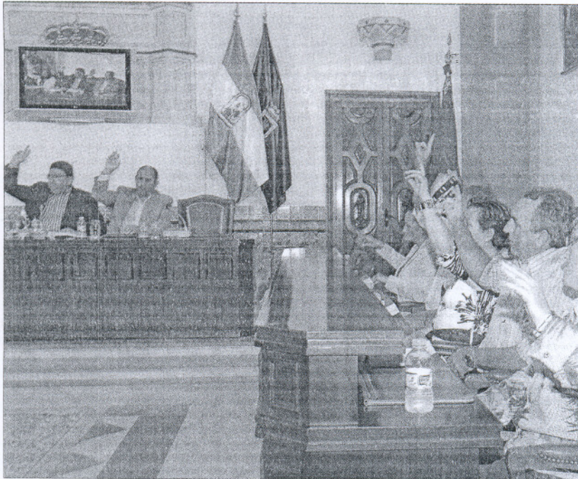
Imagen del pleno municipal de Rota del pasado miércoles.