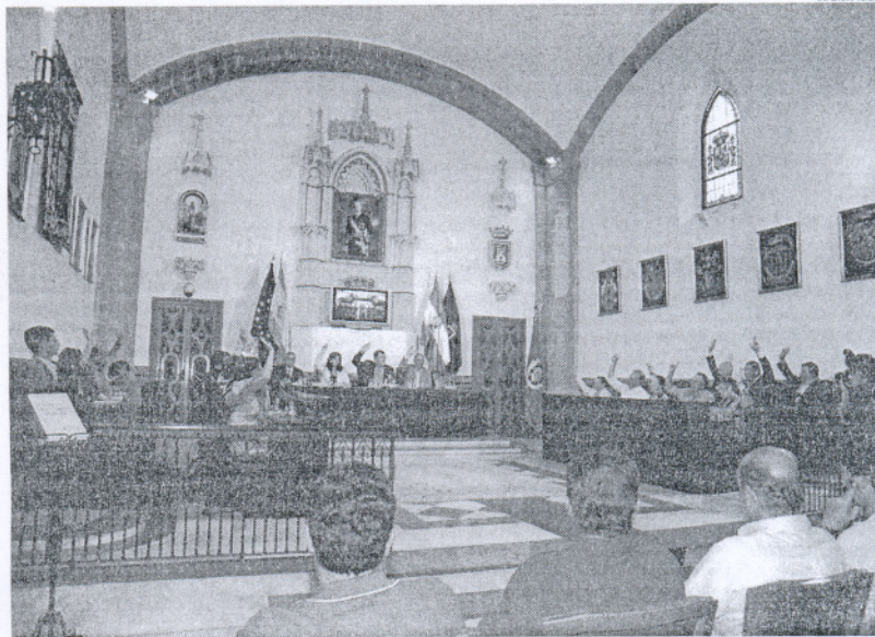
Izquierda Unida votó en contra de la propuesta presentada, considerándola "anticonstitucional".

Helices continuó con su argumentación, dejando claro desde el principio que no existía intención por parte de su grupo de "enturbiar el desarrollo del Pleno, y acataremos la mayoría respetuosamente". Para el concejal de IU, la diversidad "es enriquecedora"