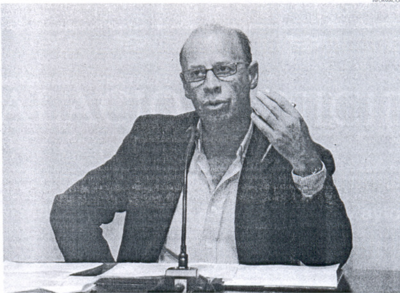
Para el edil responsable de Hacienda, el Gobierno de la nación no trata a Rota de una manera justa.

Liaño asegura que su intención no es enfrentarse al grupo municipal socialista sino que por el contrario le pide a esta formación política su colaboración, para que ayude al Equipo de Gobierno (PP y RR UU) y haga un esfuerzo para conseguir sentarse con los representantes del Gobierno y que de