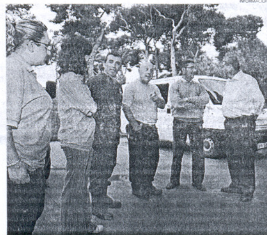
Los delegados se acercaron hasta la sede para los preparativos.

De este modo, el cuerpo de voluntarios hace de este día una muestra de su labora durante todo el año, que ha quedado más en claro que nunca tras su actuación relevante en las inundaciones del pasado fin de semana.