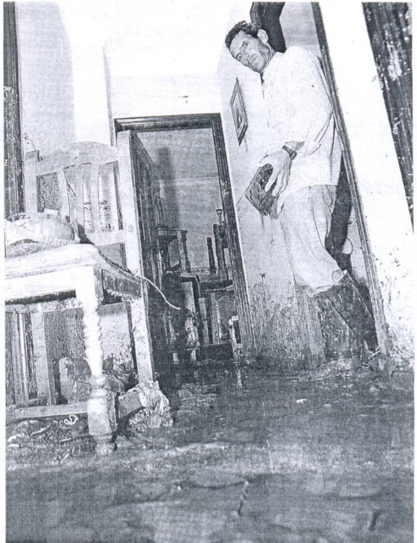
DAÑOS. Imagen de los efectos provocados por el temporal en una vivienda de La Barca.