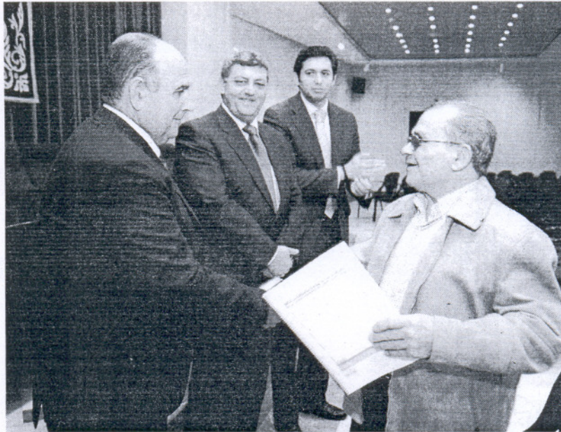
Los beneficiarios recogieron los proyectos de rehabilitación subvencionados en el Castillo de Luna.

Corrales animó a todos los ciudadanos que puedan acogerse a estas subvenciones para que aprovechen las facilidades y ayudas que