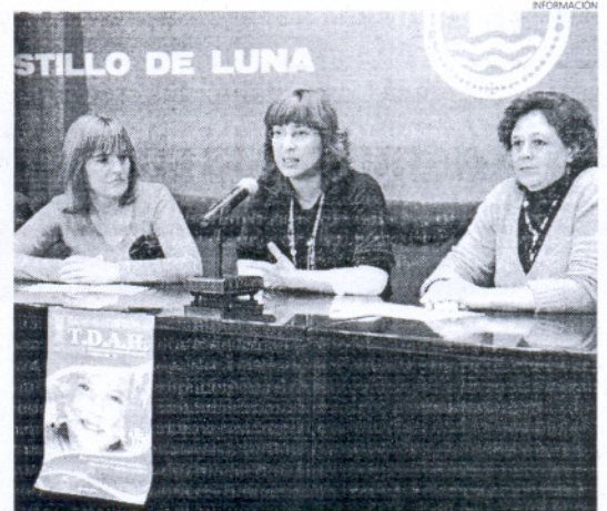
Las jornadas quieren abrir una puerta al conocimiento del trastorno.