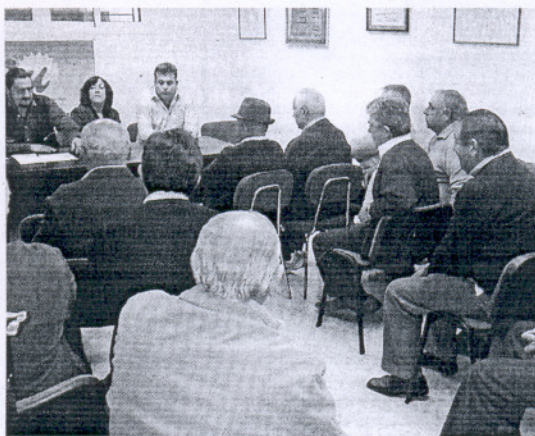
Un momento de la reunión convocada ayer por IU en la ciudad.