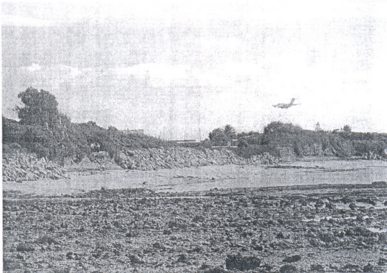
El litoral de la Costa de la Luz tiene grandes atractivos naturales pero también esta sometido a muchos riesgos.

Así el pacto toma en consideración "la riqueza paisajística y la elevada y valiosa biodiversidad del litoral gaditano", además de el elevado "dinamismo socioeconómico que presenta este litoral", en referencia a la pesca, la acuicultura, la agricultura, el transporte marítimo, la industria o el turismo. De la misma forma, el documento expresa que la "actual e inusitada presión antrópica no ha sido indiferente a los organismos públicos y privados, y en general al conjunto de la sociedad".