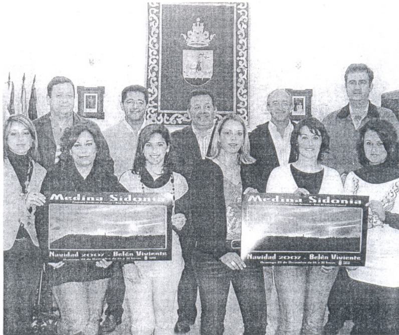
Los Reyes Magos y Carteras Reales de Medina en el acto de presentación.

En este municipio los Reyes Magos estrenarán tres carrozas nuevas que saldrán a las cinco de la tarde desde el instituto de educación secundaria de la localidad. Desde allí recorrerán la Avenida Blas Infante, y diversas calles del municipio para volver nuevamente hacia el insituto, donde finalizará el cortejo real.