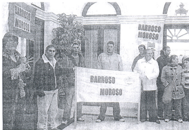
Los trabajadores de la asociación protestando en el patio del Consistorio.

Los trabajadores entregarán carbón al Ayuntamiento para reclamar que se les pague los salarios que se les deben