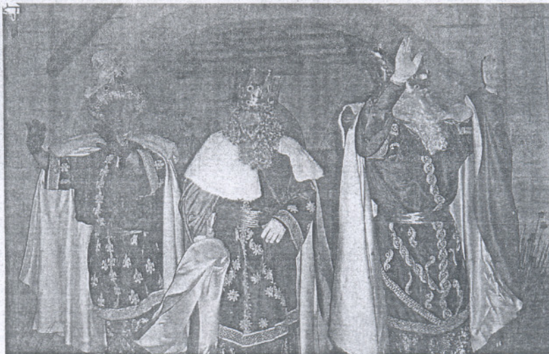
ILUSIÓN. Ya está todo listo para que sus Majestades visiten la localidad.

Desde esta plaza, los Reyes Magos se desplazarán hasta la de Bartolomé Pérez, donde realizarán la tradicional adoración al niño Jesús en el Belén. A continuación, y como novedad este año, cada uno de los Reyes se situarán en uno de los balcones de los tres edificios municipales de la plaza de España, y desde allí dirigirán unas palabras a los niños y lanzarán caramelos y regalos a todo