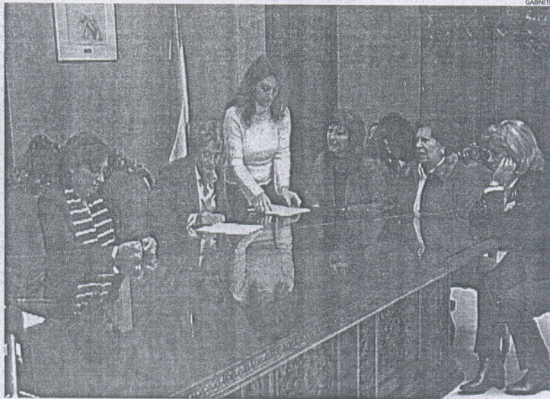
Momento en que la delegada y la presidenta firman el acuerdo de colaboración.

El convenio en cuestión, que tiene un año de duración, viene a definir y regular los términos en los que se lleva a cabo la colabo-