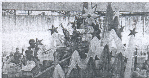
Una de las carrozas de la cabalgata de Puerto Real. / J. L. J.

Miles de niños llenaron ayer las calles de la ciudad para contemplar el recorrido de los Magos de Oriente acompañados por el Cartero Real y la Estrella. La comitiva partió a caballo del Castillo de San Marcos y continuó hacia la Plaza del Polvorista, donde los Reyes leyeron un manifiesto para felicitar a todos los portuenses. La cabalgata recorrió toda la ciudad, desde las barriadas hasta las avenidas, del extrarradio hasta el casco histórico. / I. B.