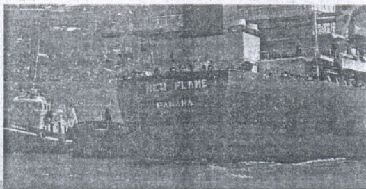
LABOR. El New Flame era ayer remolcado por otro buque.

Las manifestaciones se han producido tras el hundimiento el primer día de este año del remolcador panameño Ocean Lady a unas ocho millas de la costa ceutí por dos incendios sufridos en el interior: