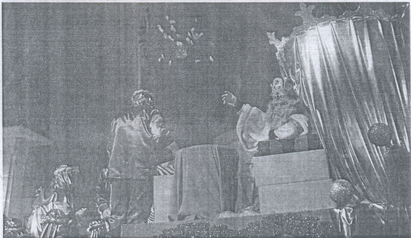
El rey Melchor repartiendo caramelos a los niños y mayores en la cabalgata de Sanlúcar.

CABALGATAS DE LOS REYES MAGOS POR LA PROVINCIA Sus majestades no faltaron a su cita de cada 5 de enero