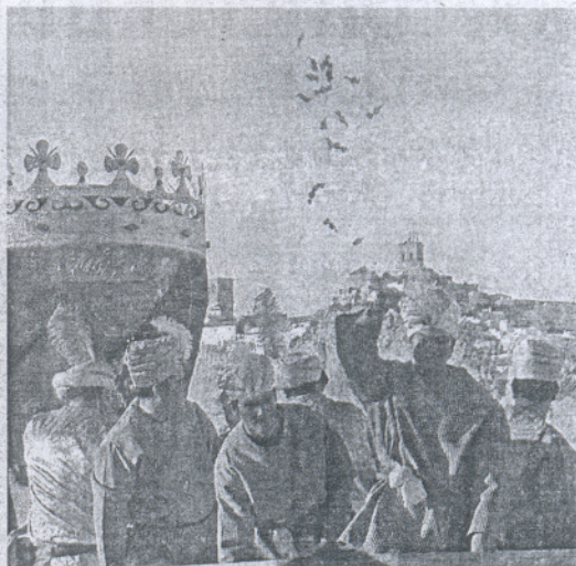
La Peña de Arcos se divisa detrás de la carroza de Baltasar.