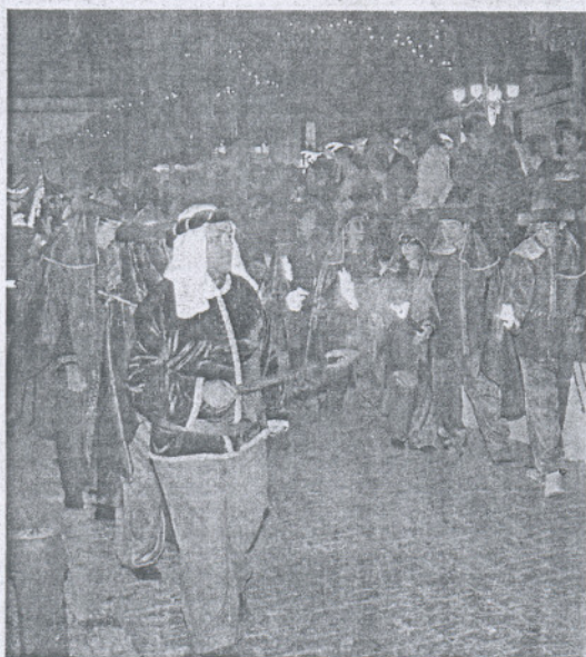
Los romanos desfilan ayer en Medina.

Puntuales, los Reyes Magos de Oriente llegaron en helicóptero al estadio Arturo Puntas para iniciar el recorrido de un cortejo con catorce carrozas. En las inmediaciones de la explanada de Renfe, cientos de roteños esperaban desde bien temprano a la cabalgata para conseguir el máximo de caramelos y juguetes, todo un reto ayer tarde. Este año, la novedad venía no solo por la iluminación de las carrozas sino por la sonorización de cada una de ellas, algo que dio más realce al cortejo. Ya en torno a las nueve y media de la noche y tras un largo recorrido, los Reyes Magos se dirigieron a la plaza de Bartolomé Pérez donde adoraron al Niño Jesús y rodeados de una gran multitud lanzaron su mensaje de ilusión.