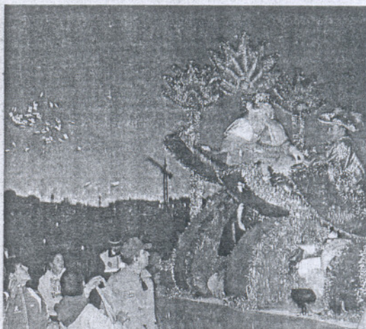
Melchor lanza caramelos desde su carroza en Vejer.