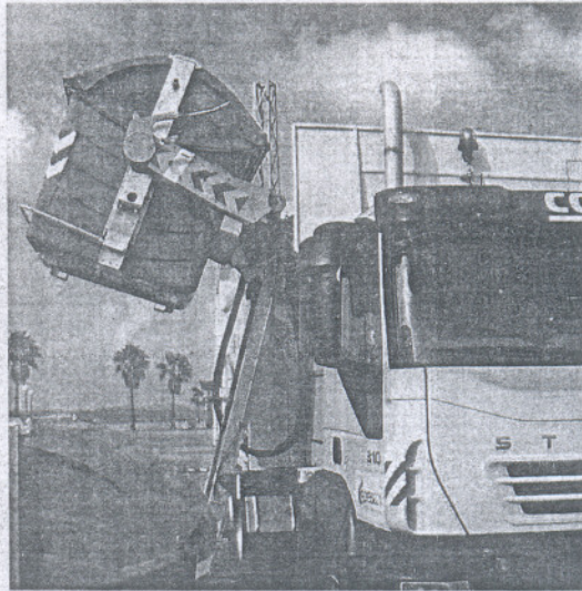
Los vecinos trasladaron su malestar al Consistorio. / PAULA ALÁEZ

En este sentido, la Junta de Gobierno Local ha decidido solicitar a la Mancomunidad, entidad que presta este servicio de recogida selectiva de envases, vidrios y papel cartón a través de su sociedad Gesalquivir, que el vaciado de estos contenedores en aceras se realice en horario diurno, concretamente de ocho de la mañana a ocho de la tarde, y que además, estos trabajos sean más regulares, pasando de dos días, a todos los días de lunes a viernes.