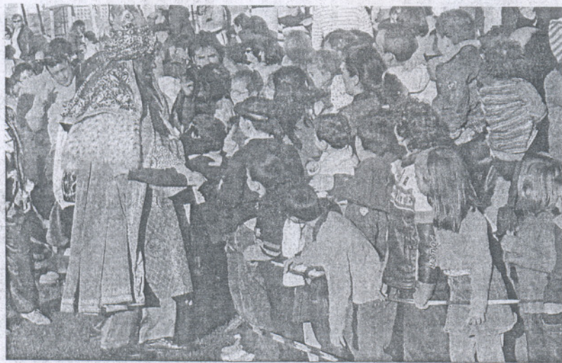
Baltasar saluda a los niños congregados en el estadio Sancho Dávila de Puerto Real.