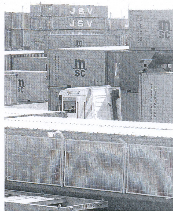
CONTENEDORES. Imagen de la terminal de contenedores del

Lorena García y Mónica Bofarull, profesoras de Economía de las Universidades de Oviedo y Tarragona, hacen también su aportación proponiendo soluciones: «Es