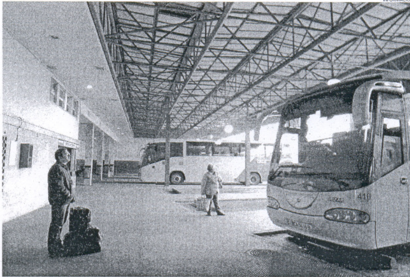
La compañía ve en la decisión de los trabajadores una "vuelta a la normalidad".