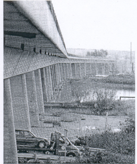
ACABADO. Imagen del nuevo viaducto en El Portal.

Para facilitar el cambio, la Junta confía en las inversiones estatales para la duplicación de