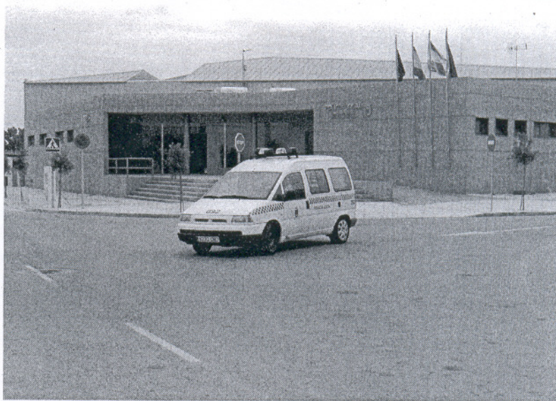
La rápida actuación policial hizo que los presuntos delincuentes se vieran sorprendidos por los agentes

Interrogados por la procedencia de los objetos, cada uno de ellos comenzó a dar una versión.