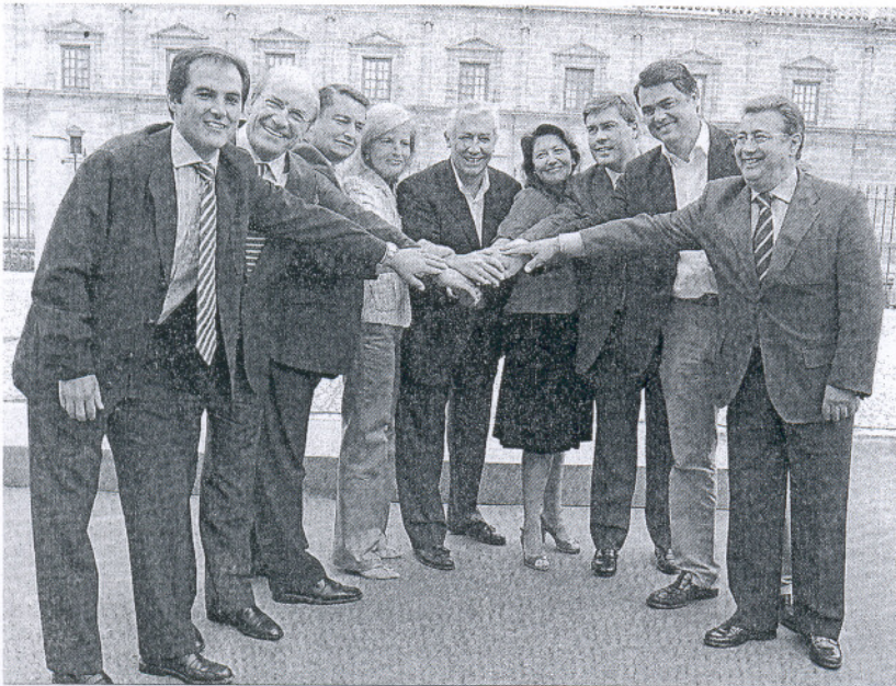
Arenas cruza las manos con los cabezas de listas al Parlamento andaluz presentados en octubre.

La dirección popular es partidaria de que la "práctica totalidad" de los regidores municipales ocupe su cargo de diputado, pese al criterio de su presidente