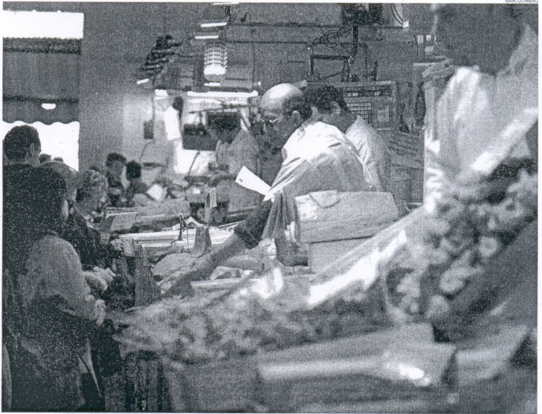
Los autónomos gaditanos tienen la pensión media más alta de Andalucía, aunque cobran un 30,55% menos que los jubilados del Régimen General.

Por tanto, la mayor diferencia entre las pensiones de los trabajadores autónomos y el resto de las pensiones se da en Cádiz con 259,56 euros menos, seguida de Huelva (222,47 euros menos), Sevilla (204,77 euros menos) y Málaga (182,88 euros menos). Por el