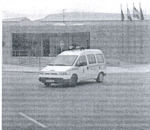
Los agentes sospecharon del menor ante las incongruencias de éste

Directamente se informó a la fiscalía de menores y ésta a su vez avisó a la Policía Autonómica para que se hiciera cargo del joven, ya que se daba la circunstancia de que llevaba varios días fuera de su domicilio reclamado por sus familiares, en concreto por su tía que es quien tiene su custodia.