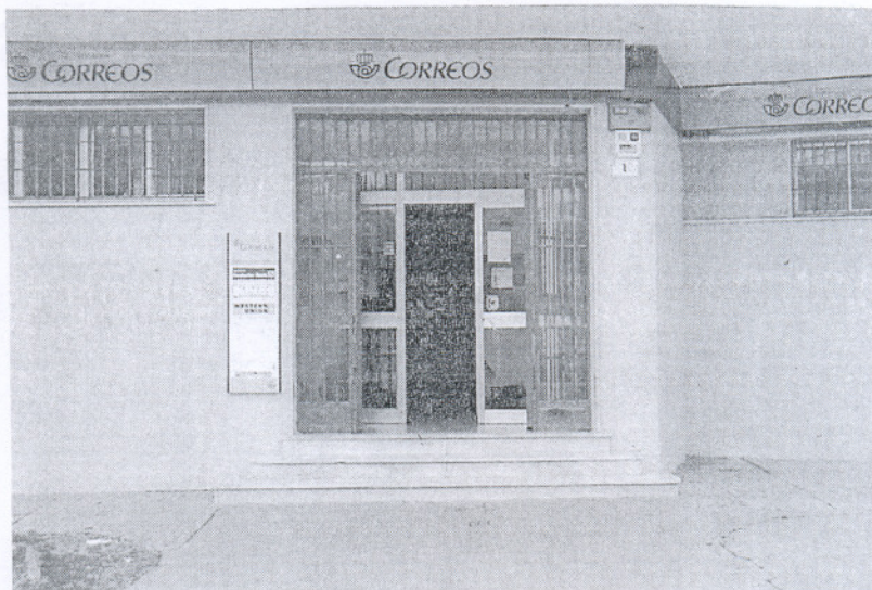
Correos por fin mejorará sus dependencias para que todos puedan acceder a ellas.