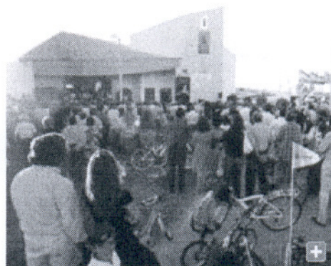
Muchos fueron los fieles que siguieron el acto desde fuera.