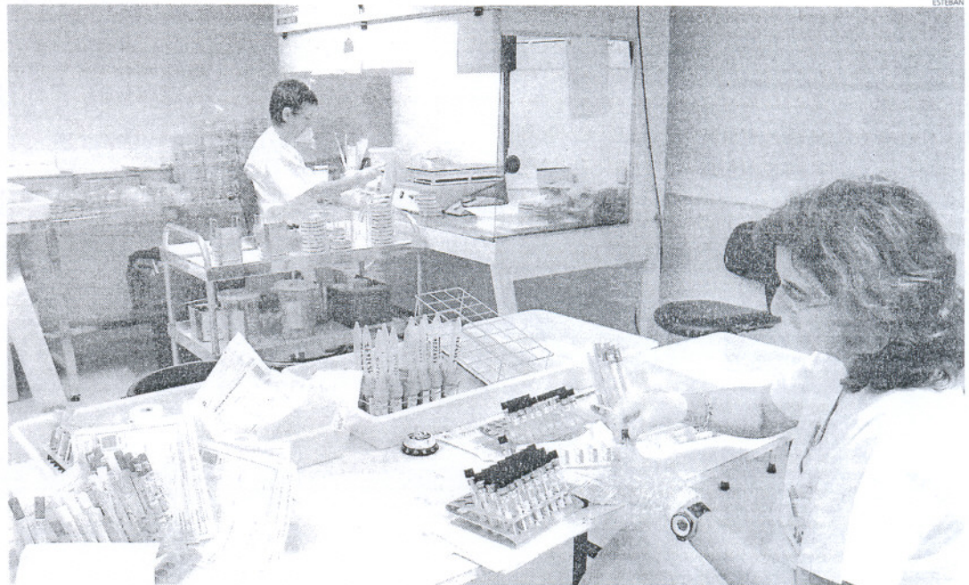
Las niñas de catorce años optarán a la vacuna que previene el cáncer de cuello de útero y que iniciará su vacunación el 15 de septiembre.

La Consejería de Salud estima que las niñas nacidas en 1994 habrán terminado de vacunarse entre abril y junio de 2009, año en