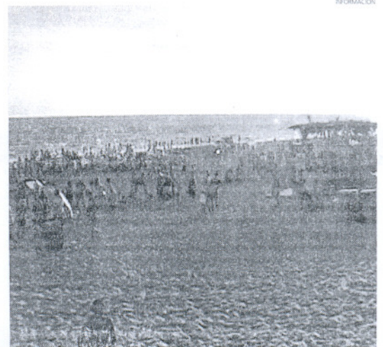
Multitud de público se congregó en la playa para disfrutar de la música.

Ante la buena acogida de esta iniciativa por parte de los jóvenes, el Área de Juventud espera poder repetir esta actividad.