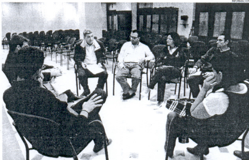
Con este plan se da apoyo a un sector tan golpeado como la construcción y a personas en situación de desempleo.

El citado documento recopila todas las obras que el Ayuntamiento tiene previsto ejecutar, de manera que se cuente con una visión global con respecto a plazos,