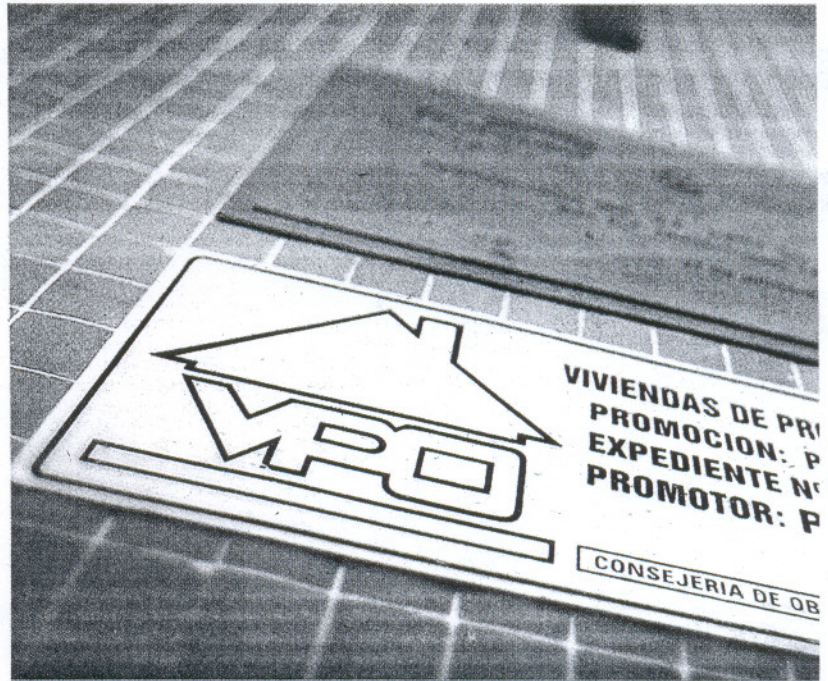
La promoción de viviendas de promoción es la principal vía pública para reactivar la construcción.

No valdrán todas las parcelas, sino solamente aquellas que estén clasificadas y calificadas para uso residencial, y que, al menos, estén inscritas dentro un Plan Parcial aprobado definitivamente. Además, deberán tener una superficie y una edificabilidad suficientes para promover, al menos, 300 pisos, un requisito que complica la viabilidad de este programa en ciudades limitadas como Cádiz o La Línea. El precio que se pagará por ellas se basará en el importe medio del metro cuadrado de vivienda protegida establecido para el municipio al que pertenece, y se descontarán, eso sí, los costes de urbanización y financieros, las cargas y los impuestos.