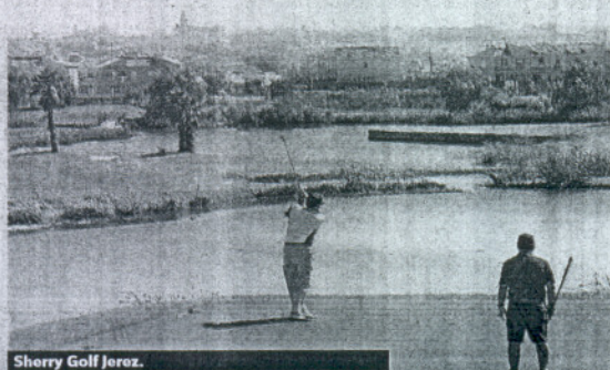
Sherry Golf Jerez.

Los patrocinadores del torneo, encabezados por la firma Discavi-La Casa de los Jamones, se volcaron con los premios ofrecidos a los jugadores como premios directos y para el sorteo, ofreciendo un amplio y variado surtido de productos ibéricos que fueron del agrado de los participantes.