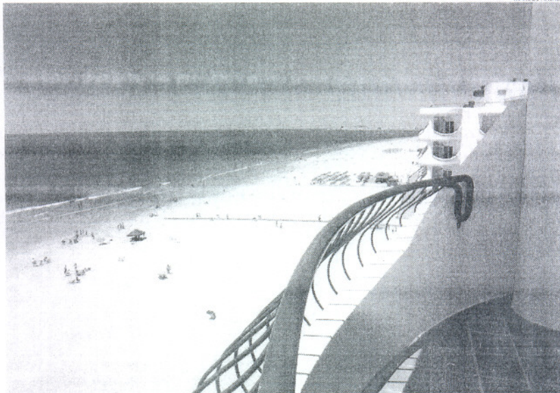
El año pasado se inició la red de senderos como la conexión entre Cádiz y San Fernando.

El Ministerio destaca también como acción clave del pasado año el Pacto por la Defensa de la Costa de la Luz, una iniciativa promovida por Costas y que cuenta con la colaboración del resto de