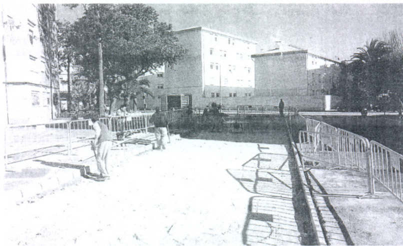
ACTUACIÓN. Los operarios municipales ya se encuentran trabajando en ello

Por otra parte, el delegado de Servicios Municipales recordó que