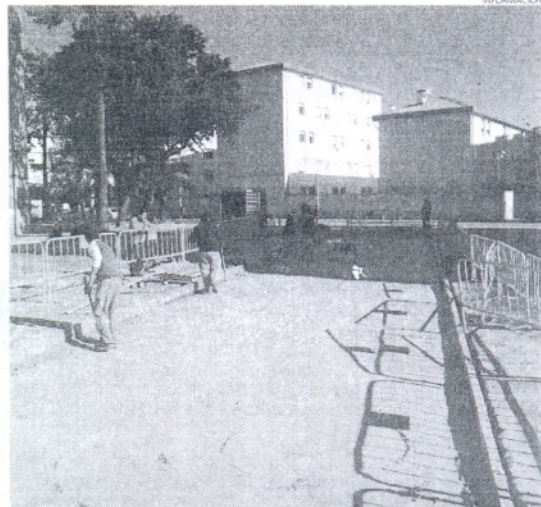
Aprovechando la amplia acera se han obtenido nuevas plazas.

Finalmente, el delegado municipal de Servicios Municipales puso de manifiesto que las mejoras en esta zona continuarán en breve con la puesta en marcha de las obras de la primera fase de los 178 aparcamientos subterráneos que darán a la calle Cibeles, una actuación de envergadura que contribuirá sobre todo a la revalorización de las viviendas y al aumento de la calidad de vida de los vecinos, tras los arreglos en solearía y jardines.