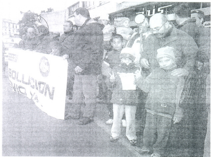
A PIE DE AUTOBÚS. Imagen de la manifestación de trabajadores de ayer por la tarde.