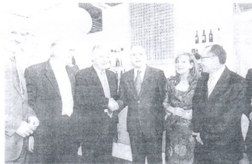
El presidente de la Junta acompañado de políticos gaditanos.