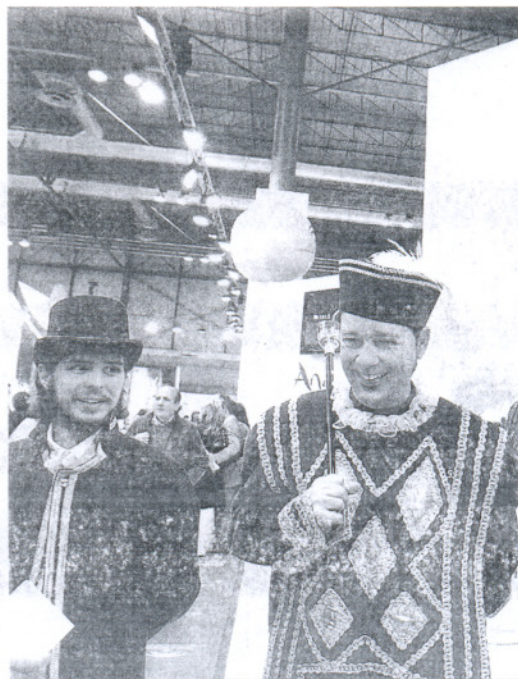
Actores recrean en el stand de Cádiz escenas de la firma de La Pepa.

La perspectiva del touroperador es iniciar sus operaciones en la temporada de 2009 con vuelos