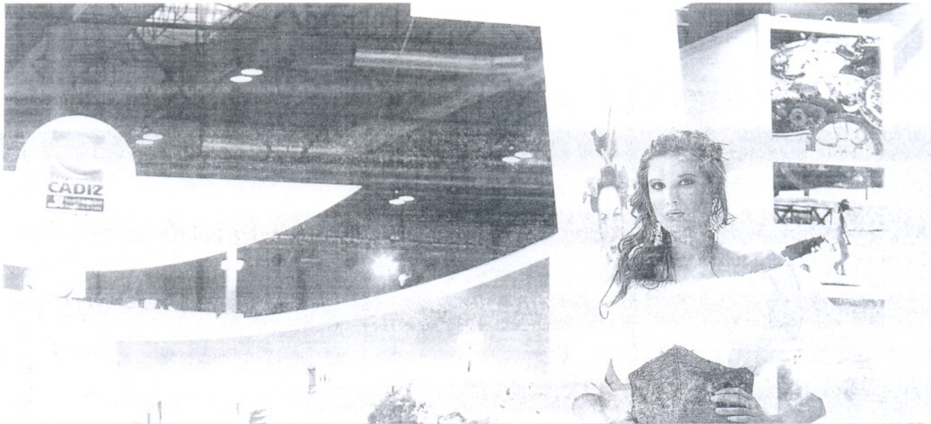
Una joven modelo posa con traje típico de Andalucía frente al expositor de la provincia de Cádiz en la jornada inaugural de Fitur 2008.