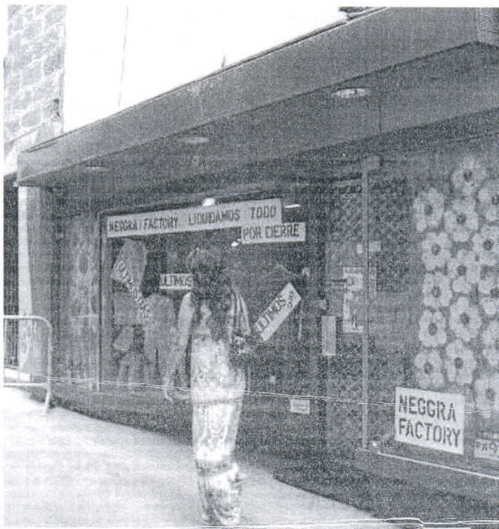
Numerosos locales comerciales del centro han tenido que cerrar sus puertas.

Ante esta situación aparece la necesidad de solventar los problemas que acarrean hace meses. Un punto de vista en común de todos los comerciantes es el elevado precio del alquiler de sus locales. Los gastos generales no les permiten sacar a flote el negocio. Por ello las asociaciones de comerciantes solicitan la