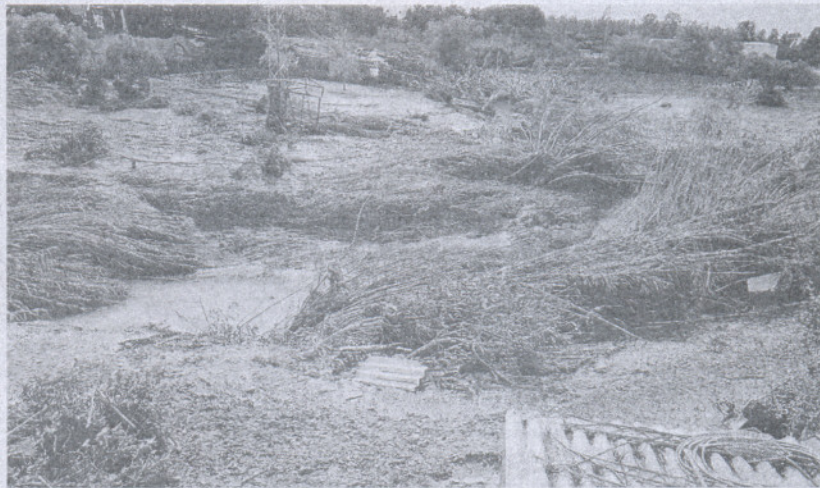
EFFECTOS. El Gobierno aprobará ayudas por los daños ocasionados en la provincia. / CRISTÓBAL

El acuerdo que aprobará hoy destaca que el temporal de lluvias ha producido daños en varios municipios de la provincia de Cádiz, siendo los más afectados los habitantes de la Bahía de Cádiz, donde hay numerosas familias que han sufrido graves pérdidas en sus viviendas y enseres de primera necesidad, así como los de la zona rural del municipio de Jerez. Sólo en la pedanía de La Barca de la Florida hay 100 viviendas afectadas, 25 de ellas de forma muy grave.