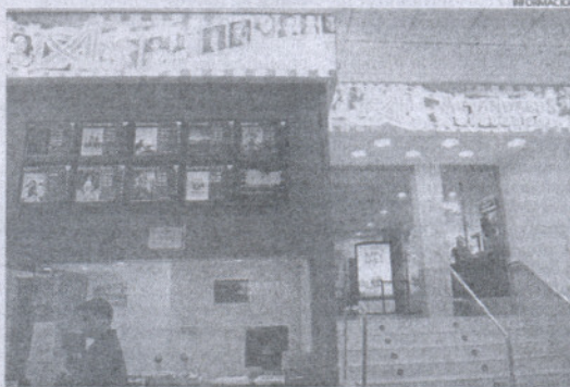
Ver una película varía de precio en función del horario.

El precio más reducido se encuentra en Al Andalus Multicines en Sanlúcar de lunes a viernes o Al Andalus Centro en Cádiz, ya que no sube de los 3,8 euros.