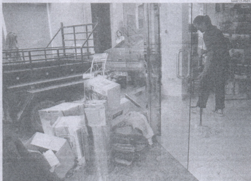
El Gobierno aprobará hoy ayudas para resarcir los daños causados por el temporal del sábado pasado.