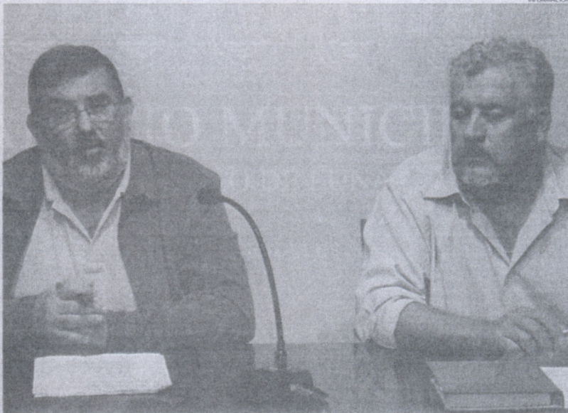
El técnico de la OMIC ha destacado el buen comportamiento de los ciudadanos que han acudido a la oficina.

Por otro lado, se ha dispuesto un número de teléfono, el 956.82.91.30 para solicitar cita previa. El objetivo de esta medida es poder atender a personas que son de fuera de la localidad, pero que son propietarios de una vivienda, y que no saben todavía en qué estado se encuentra ésta tras las lluvias. De esta manera, y gracias al sistema de la cita previa, pueden venir sin preocupaciones para recibir asistencia. También se ha pensado en este sistema para aque-