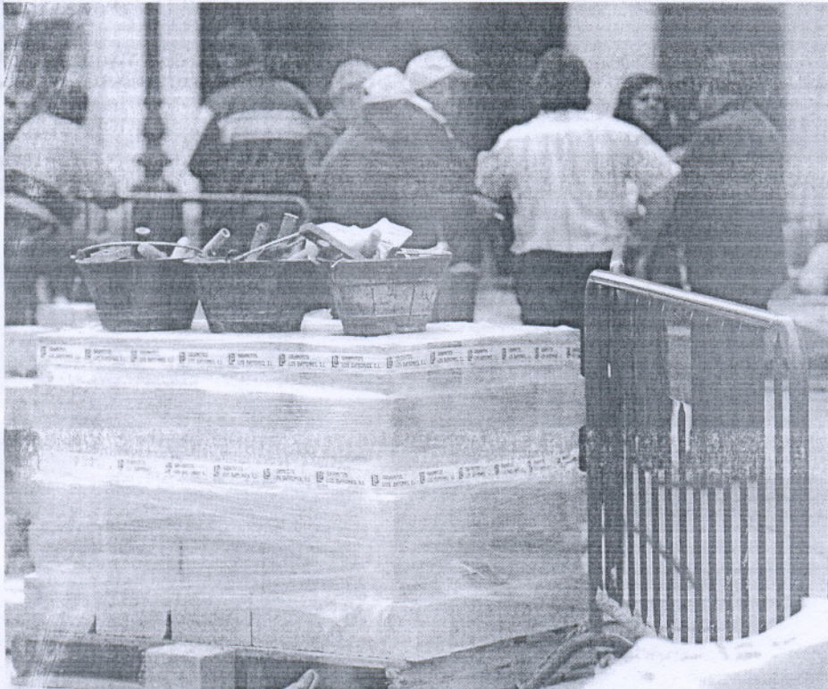
Paro de protesta de unos albañiles en unas obras municipales de Córdoba.

La Intervención General del Estado podrá verificar que los recursos se han destinado a financiar las inversiones previstas con la correspondiente creación de puestos de trabajo. Los cálculos que maneja Junta y Gobierno es que las medidas suponga una creación de empleo de entre 35.000 y 40.000 nuevos puestos de trabajo hasta 2010.