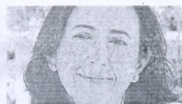
Rosa Aguilar ALCALDESA DE CÓRDOBA (IU)

"Es un acierto impulsar la economía desde los ayuntamientos, somos ágiles y eficaces para responder ante los ciudadanos"