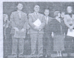
Momento del homenaje.

La Salle y el centro de adultos reciben las insignias de oro de la localidad