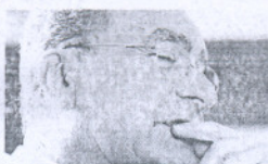
Francisco de la Torre ALCALDE DE MÁLAGA (PP)

"Es un acierto impulsar la economía desde los ayuntamientos, somos ágiles y eficaces para responder ante los ciudadanos"