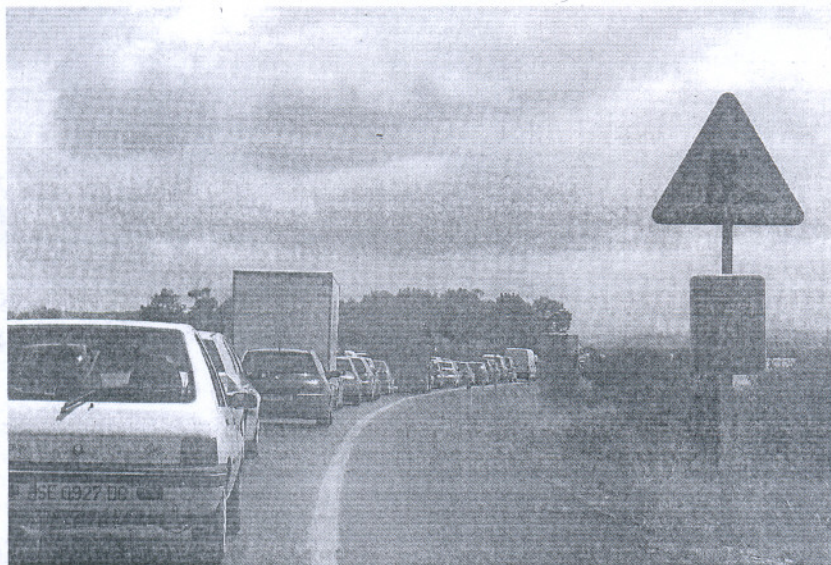
MEJORAS. Imagen de la carretera A-491 en unas obras anteriores.