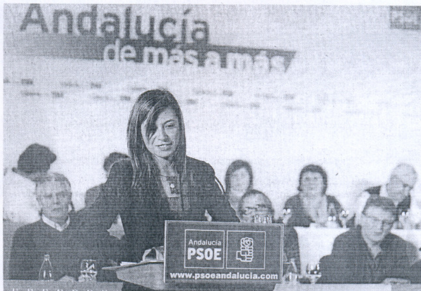
«TRABAJAR Y TRABAJAR...». La ministra de Igualdad, en un momento de su discurso.

El presidente de la Diputación y máximo dirigente provincial de los socialistas considera que «nosotros tenemos herramientas suficientes y un compromiso político sólido para superar esta crisis, porque estamos