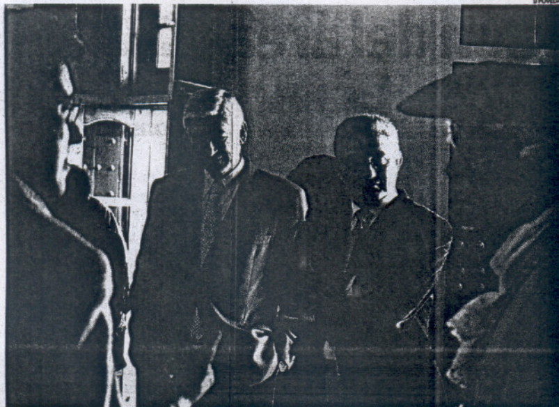
El delegado del Gobierno y el de Obras Públicas, dos de los seguros para los próximos cuatro años.