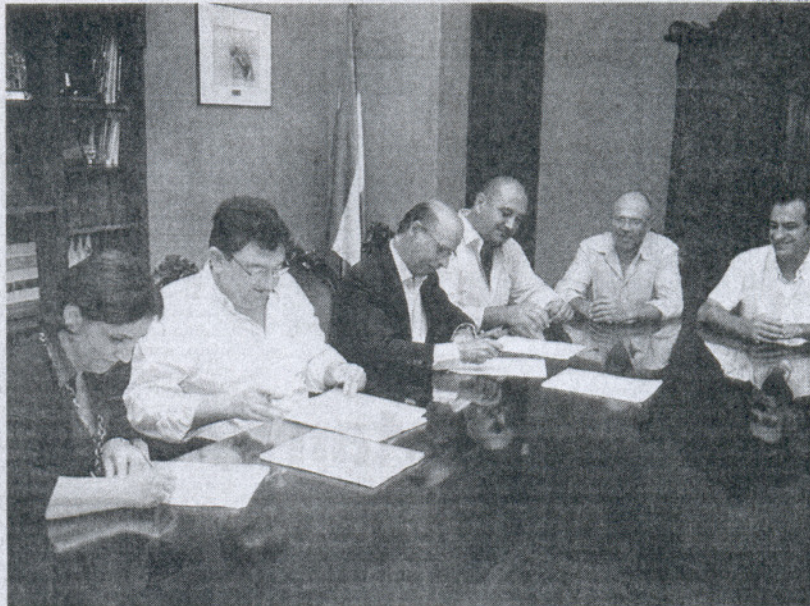
Con la firma de este nuevo convenio laboral se cierra un capítulo necesario en el Consistorio desde hace años.

El responsable municipal subrayó que este acuerdo tiene un período de vigencia que va del 2008 al 2011, una duración de cuatro años que corresponde con la "política que desde Personal se in-