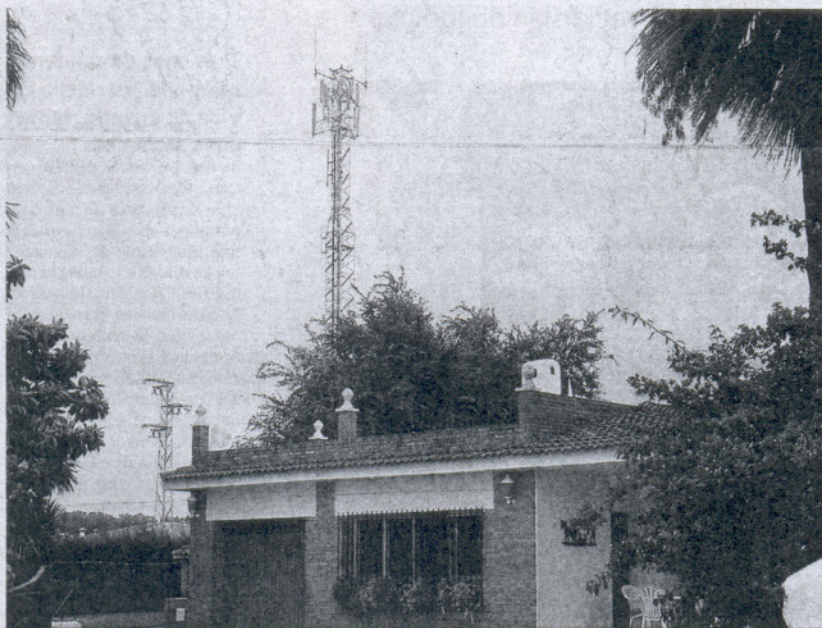
Una antena de telefonía móvil en el núcleo de El Colorado, en el término municipal de Conil.

En Cádiz hay una media de un móvil en uso por habitante, es decir, más de 1,2 millones de aparatos y una penetración en el mercado del cien por cien. A esta cifra se le añaden los miles de tu-