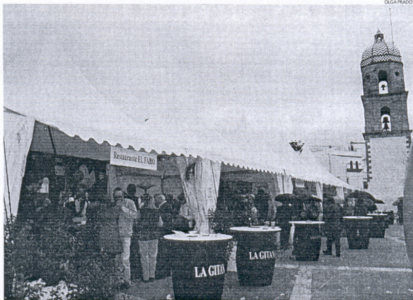
La lluvia frustró el paseo a muchos de los que se acercaron a disfrutar de las deliciosas tapas en la Merced.

Para la delegada municipal, el cambio de ubicación ha sido "un acierto", apuntando que la plaza de la Merced es un punto que atrae a ciudadanos y visitantes has-