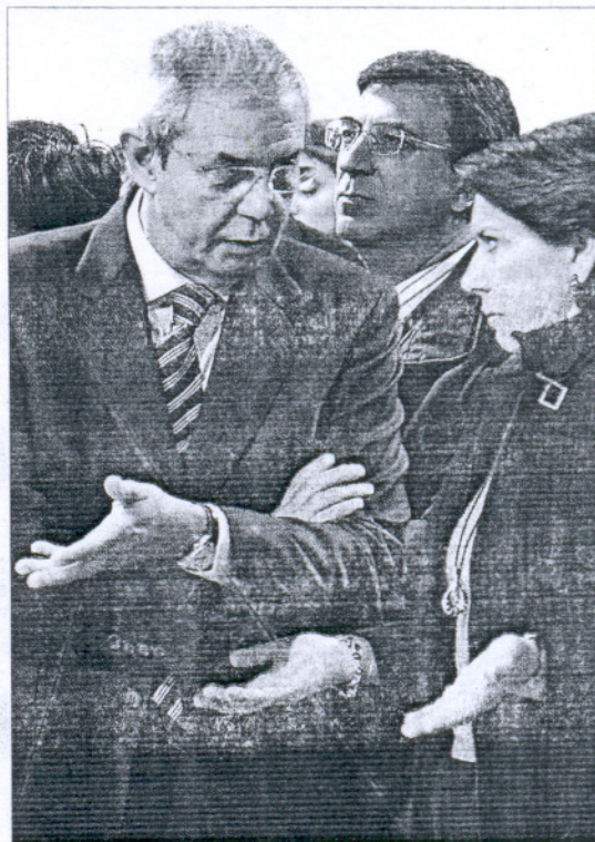
Emilio Pérez Touriño y Magdalena Álvarez, en Vila de Cruces (Pontevedra), donde visitaron un viaducto del futuro AVE.

Las reclamaciones de los ayuntamientos son principalmente dos: por un lado, que el Gobierno les autorice a contraer deuda para "atender con carácter inmediato los pagos" a las empresas que prestan servicios públicos, y que les permita cerrar 2008 y 2009 con déficit; por otro, que modifi-