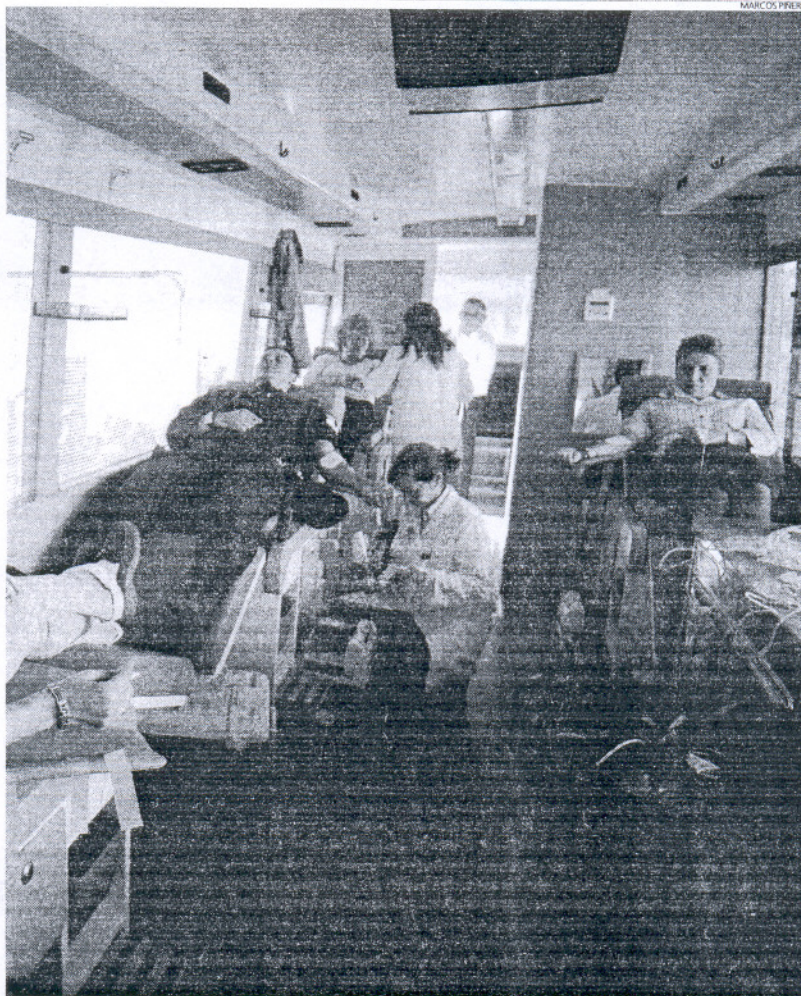
Imagen de una unidad móvil del CRTS donde cualquier ciudadano puede donar sangre de forma voluntaria.

Es destacable que son las poblaciones con menos habitantes de la mancomunada-Puerto Real y Rota-las que tienen una mayor tasa de donación, mientras que las más pobladas-El Puerto, San Fernando, Chiclana y Cádiz-van a menos. Con todo esto, la capital gaditana es la que más donaciones de sangre realizó en 2007, unas 3.045. Le siguen La Isla (2.010), Puerto Real (1.625), El Puerto de Santa María (1.499), Chiclana (1.419) y Rota (1.227). No obstante y pese a que la villa roteaña tiene el menor número de donaciones, su tasa es la más alta, un 44,5 por mil. Pese a ser la que más donaciones ha registrado, la tasa de Cádiz se queda en un 26,49 por mil, la de San Fernando en un 21,15 por mil, Chiclana en un