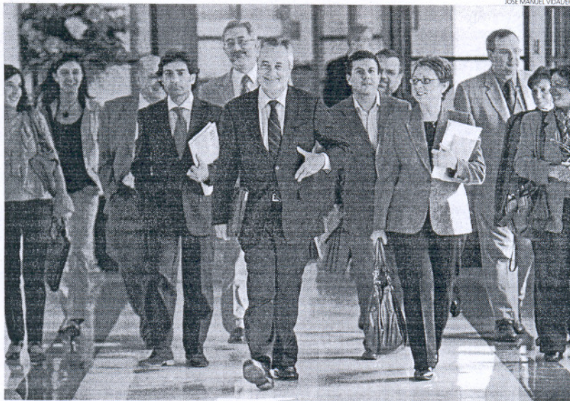
El vicepresidente segundo y consejero de Economía llega a la comisión acompañado por su equipo al completo.

Por otro lado, Toscano dijo que con la aprobación de la Ley de Régimen Local, antes del 30 de ju-