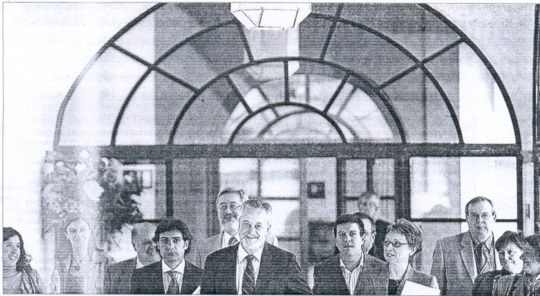
Grinán con el equipo de su consejería, ayer en el Parlamento andaluz.