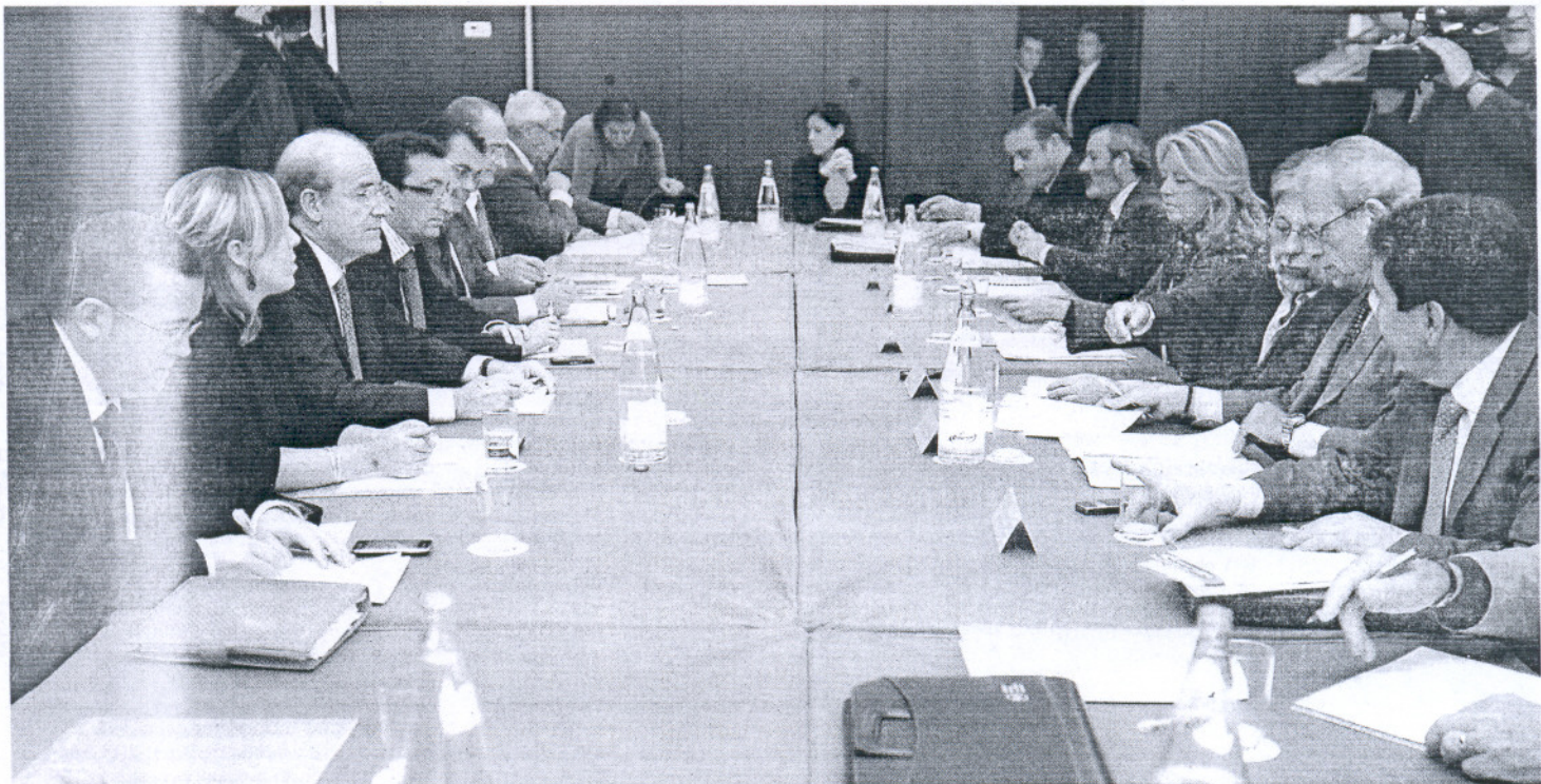
La reunión de la comisión ejecutiva de la Federación Andaluza de Municipios y Provincias (FAMP) se celebró ayer en un clima de consenso