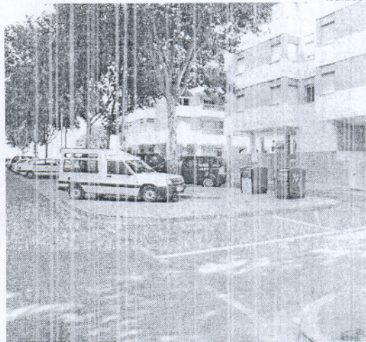
Hasta ahora sólo podían aparcar coches de Protección Civil.

Para el teniente de alcalde esta actuación pone de manifiesto la constante preocupación e interés de este Ayuntamiento por incrementar el número de plazas de aparcamiento en la ciudad, no sólo a través de proyectos de envergadura, sino también a través de actuaciones de menor calado, pero que también contribuyen a recuperar espacios que puedan ser usados como aparcamiento por los vecinos.