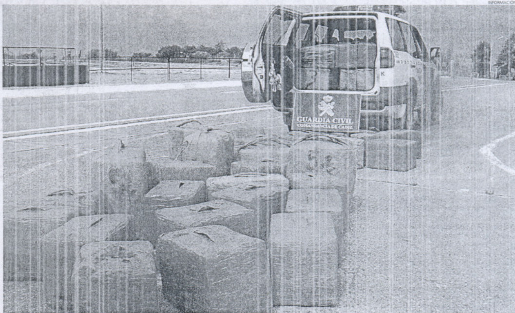
Alijo de hachís incautado por la Guardia Civil en uno de los operativos desarrollados en la provincia gaditana.

El alijo más destacado de agosto ascendió a 1.555 kilogramos de hachís, que fue interceptado por la Guardia Civil el día 22 en una embarcación neumática a la deriva y sin tripulación que fue detectada por el Sistema Integrado de Vigilancia Exterior (SIVE) en la playa Corral de Luna, en Rota.