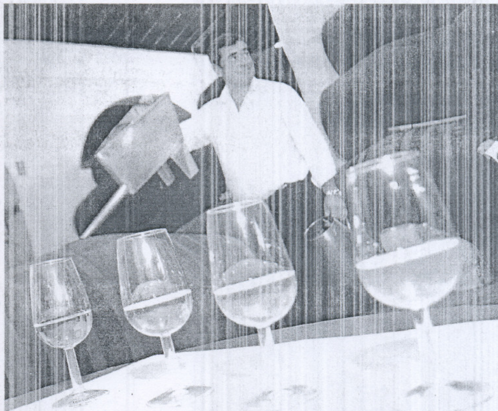
La uva con la que se hace la Manzanilla de Sanlúcar deben madurar en condiciones especiales.

El Consejo Regulador ampara diferentes tipos de vinos que se pueden clasificar en tres tipos: los Generosos, Gene-