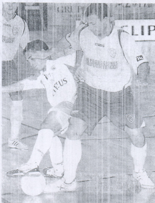
Un lance del duelo disputado entre nazarenos y gaditanos.

El Clipeus Nazareno bate en semifinales a los gaditanos, que hoy buscarán la tercera plaza ante el Maderas Miguel Pérez