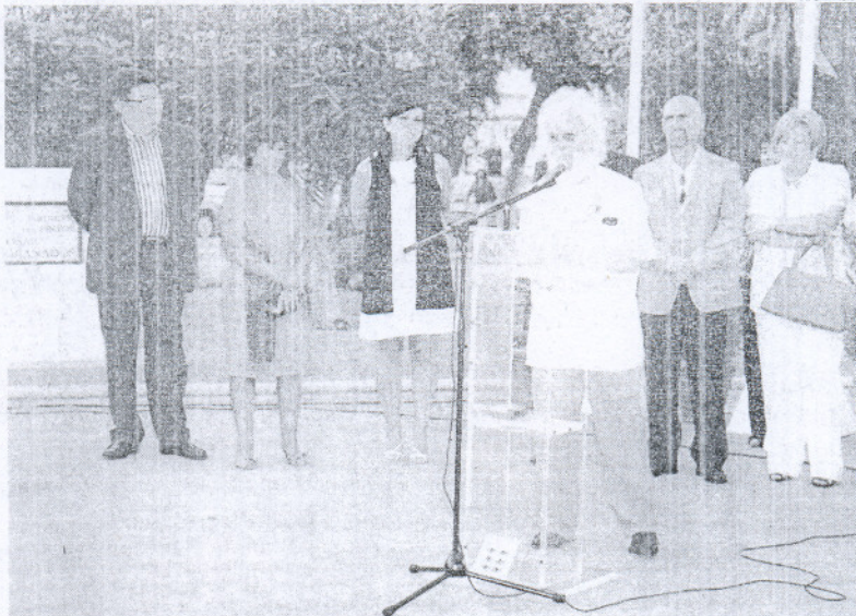
El pintor tuvo unas emotivas palabras de agradecimiento a todo el equipo de Gobierno y los involucrados.