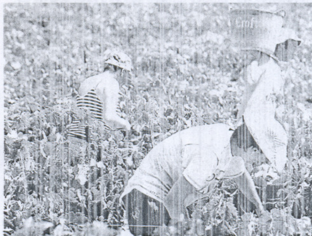
La recogida a mano es una características de la vendimia

Moscatel y Pedro Ximenez son vinos Dulces Naturales que completan esta terna. Se trata de vinos especialmente dulces, muy sabrosos al paladar y con aromas que recuerdan a las pasas, suaves y equilibrados. Su graduación ronda los 17 grados.